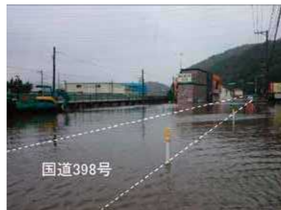
冠水状況(令和元年10月12日台風第19号)