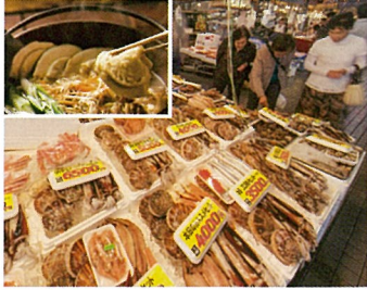
▼八戸名物せんべい汁