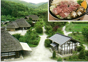
▶遠野名物じんぎすかん

(青森県八戸市) 鮮魚、乾物、飲食店など約60店の専門店が軒を連ねています。買った魚を炭火焼きで食べることができる「七厘村」もあります。