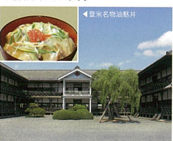
13 みやぎの明治村 (宮城県登米市)

「迎(ムカエル)」「結(ユワエル)」「拓(ヒラケル)」「創(ウマレル)」からなる4つの商業観光施設が立地。地元食材を楽しめる飲食店などが出店。