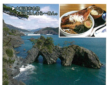
10 碓石海岸 (岩手県大船渡市)

東日本大震災で樹齢300年を超える数万本の松が流出。奇跡的に残った一本松は復興のシンボルとなっています。