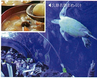
2 久慈地下水族科学館 もぐらんぴあ (岩手県久慈市)

復興道路・復興支援道路沿線には魅力的な観光地・グルメがたくさんあります。道路整備によってグッと近くなった観光地にぜひおでかけして、元気になった東北を実感してください。