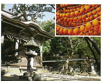
20 梁川八幡神社 (福島県伊達市)

相馬で水揚げされた新鮮で安い魚類をメインに、相馬に縁のある地域の特産品も充実した品揃え。相馬で買い物するからこそおすすめ。地元素材にこだわったメニューを提供する食事処も併設しています。