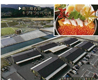
14 さんさん商店街 (宮城県南三陸町)

仙台伊達藩の一門、登米伊達氏の旧城下町、とよま。「みやぎの明治村」とも呼ばれているこの町は史跡や文化財が多く残るレトロタウン。