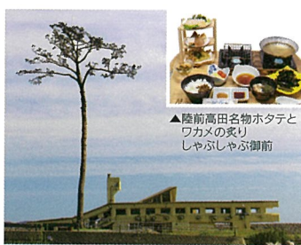
9 高田松原(奇跡の一本松) (岩手県陸前高田市)

奥州藤原氏の軌跡を辿り、みちのくの歴史と文化が体験できる歴史テーマパーク。時代衣装着付や弓矢体験が人気。大河ドラマをはじめ、映画などのロケ地としても知られています。