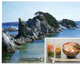
4 浄土ヶ浜 (岩手県宮古市)

国の史跡に指定されており、日本百名城の一つとしても知られています。春は桜の名所、秋は見事な紅葉に彩られるなど、四季を通じて親しまれています。