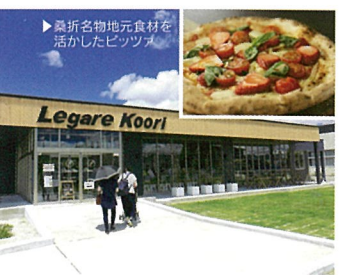
18 レガレこおり (福島県桑折町)

初代仙台藩主伊達政宗が1610年に築城。城跡の一部は青葉山公園となっており、仙台市内・太平洋を一望できます。