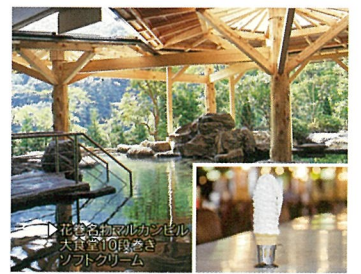
5 花巻温泉郷 (岩手県花巻市)

日本の渚百選、日本の水浴場88選、日本のかおり百選に選定された宮古を代表する景勝地です。