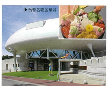
15 石ノ森萬画館 (宮城県石巻市)

旬の食材を贅沢に盛ったA級グルメ「南三陸キラキラ丼」提供の飲食店をはじめ、鮮魚や土産物などが揃う商店街。震災復興祈念公園に繋がる中橋は夜のライトアップも魅力です。