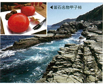
7 千畳敷 (岩手県釜石市)

花巻温泉郷は12の温泉からなり、その泉質も雰囲気もさまざま。ひきまるとともに熱い湯やしっかりとりするすべすべの美肌の湯など、多様な温泉を楽しめます。