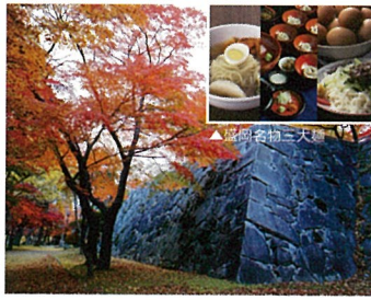
3 盛岡城跡公園 (岩手県盛岡市)

日本で珍しいトンネルに作られた水族館。世界中のライブカメラと連動した「触れる地球」でアフリカの野生動物なども楽しめます。