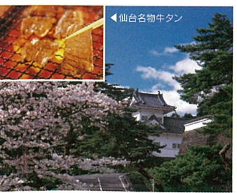
17 仙台城跡 (宮城県仙台市)

石ノ森章太郎の貴重な原画の展示や映像シアター、体験アトラクションなどが楽しめる人気スポットです。