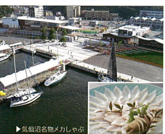
12 ないわん (宮城県気仙沼市)

国の名勝・天然記念物に指定された約6kmの海岸線。周辺には市立博物館、世界の橋館・碓石、キャンプ場などの施設も整備されています。