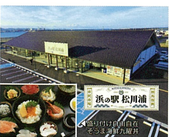
19 浜の駅 松川浦 (福島県相馬市)

「PizzaSta by Al chè cciano」では地産地消の第一人者である奥田政行シェフが全面プロデュースのもと地元採れたての旬な食材を使用したピッツァ等が楽しめます。