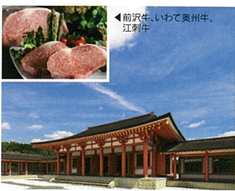
8 歴史公園えさし藤原の郷 (岩手県奥州市)

自然が作りあげた広大な千畳敷など圧巻の海岸美が堪能できます。甲子柿は甲子地区で育った渋柿の一種「小枝柿」を煙でいぶし、甘みを凝縮させた柿。ドレッシングやスイーツもあります。