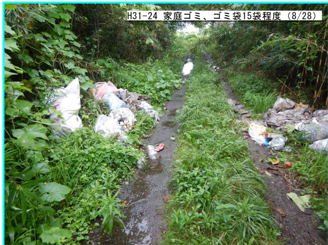
H31-24 家庭ゴミ、ゴミ袋15袋程度 (8/28)