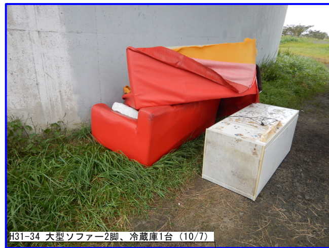
H31-34 大型ソファ2脚、冷蔵庫1台 (10/7)