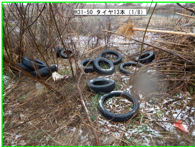
H31-50 タイヤ13本 (1/8)