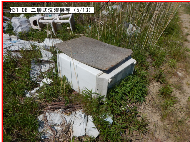
H31-08 二層式洗濯機等 (5/13)