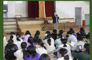
川口建設専門官と児童たち