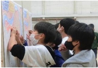
防災マップで自宅を探す児童たち

逢隈小学校6年生106人は、防災教育の中で「命を守る行動をとるために」どうすべきかを学んでいます。12月7日、仙台河川国道事務所の出前講座で、阿武隈川と自分たちの住むまちの水害の歴史について学びました。