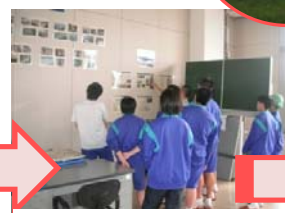
東日本大震災時の阿武隈大堰の様子の説明