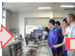
監視カメラ操作体験中