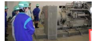
停電時には発電機が作動します(予備発電機室)