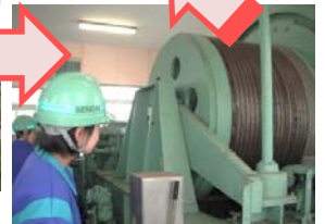
管理棟にある巻き上げ機を見学

9月6日(日)に「おおくま歩け歩け大会」を開催します！ 逢隈地区まちづくり協議会 HPアドレス http://www.wa-tukuri.jp/publics/index/35/