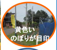
黄色いのぼりが目印