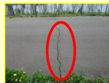
天端舗装上の亀裂

今回の点検で、緊急を要する大きな問題は確認されませんでしたが、堤防を健全に保っていくためにも、洪水に備え適切に管理していきます。