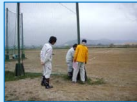
あぶくま公園運動場(亘理町)