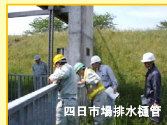
四日市場排水樋管