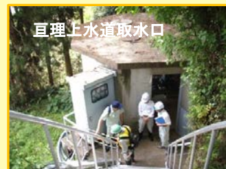
亶理上水道取水口