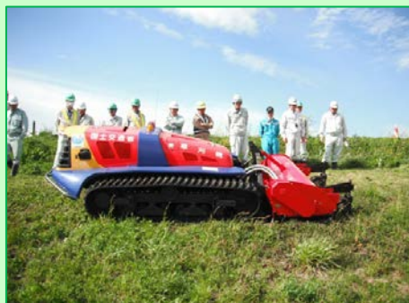
リモコン除草機(大型遠隔式草刈機)

堤防の変状箇所(のり崩れ、亀裂、漏水、モグラ穴等)を早期に発見することを主な目的として実施しています。治水安全度を保つうえで重要な維持管理の作業です。ゴミの不法投棄などの周辺環境を良好に保つことにも効果的です。