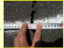
亀裂を計測(経過観察)