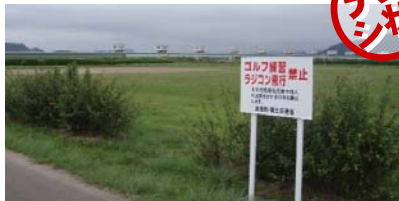
阿武隈大堰運動公園