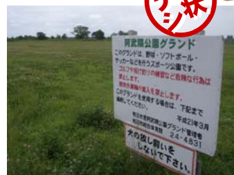
岩沼市河川公園グラウンド