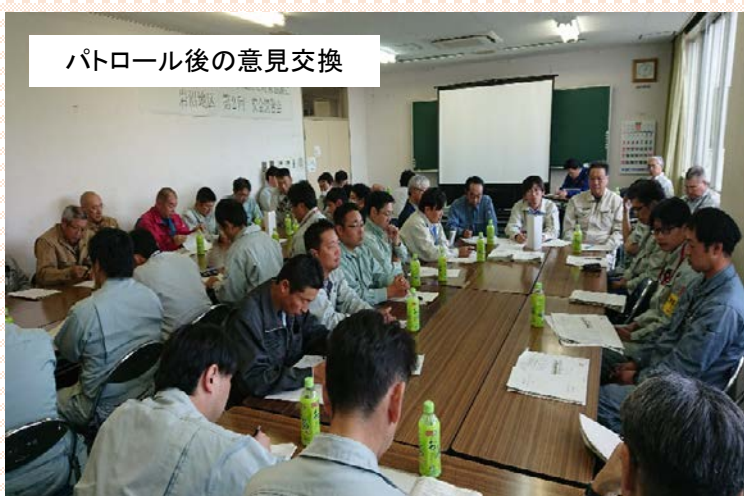
パトロール後の意見交換