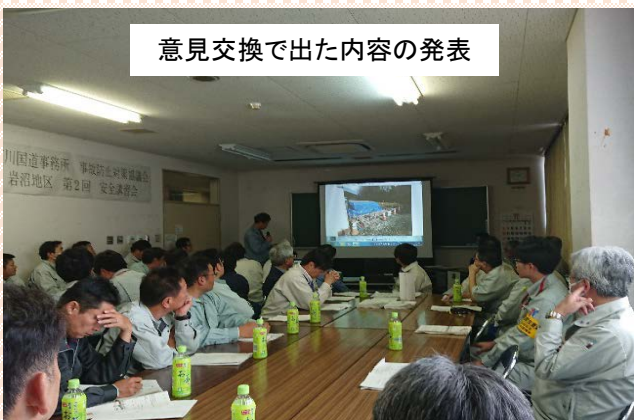
意見交換で出た内容の発表