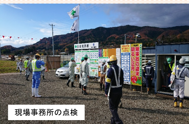
現場事務所の点検