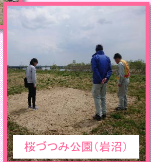
桜づつみ公園(岩沼)