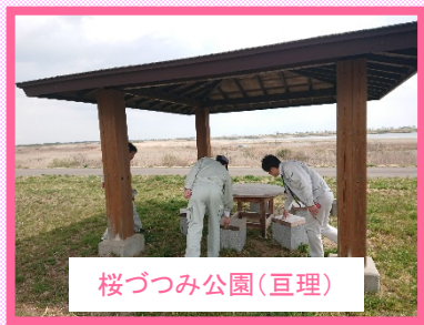
桜づつみ公園(亶理)