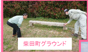
柴田町グラウンド

4月19日(金)に安全利用点検を行いました。 安全利用点検は、河川利用者が安全に利用できるかという観点で、堤防、河川敷、護岸、水門などの施設やその周辺を主な点検対象としています。 河川施設の利用が多くなるゴールデンウィーク前に安心して施設をご利用いただけるよう河川公園やグラウンドの管理者(占有者)と施設に危険な箇所がないか点検を行いました。 河川公園等を利用される方は、安全のため天候や河川の増水等に十分ご注意ください。