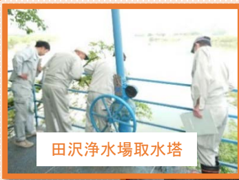
田沢浄水場取水塔