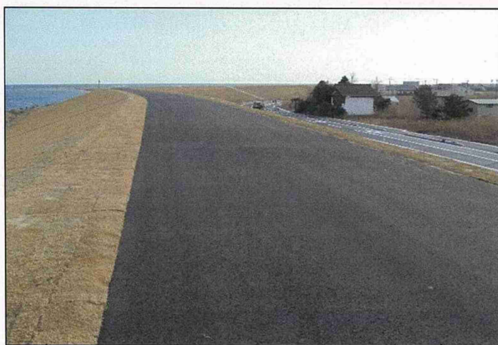
【川表張芝・天端舗装】