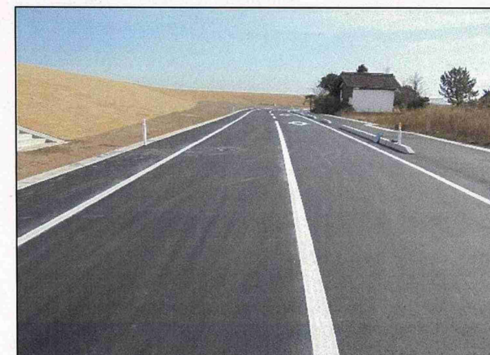
【県道荒浜港今泉線】