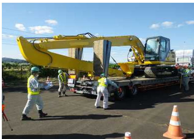
特殊車両の寸法測定状況