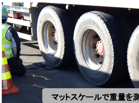
マットスケールで重量を測定