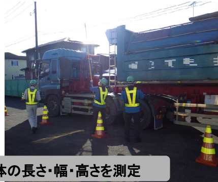
車体の長さ・幅・高さを測定

違法に重量を超過した車両は、道路や橋などの構造物に大きなダメージをあたえます。また、高さや幅を超過している車両は、橋梁等に衝突する重大事故を引き起こす原因にもなります。そのため、国土交通省では、違法通行している大型車両の指導・取締を行い、適正な道路利用の促進し良好な道路環境の維持に努めています。