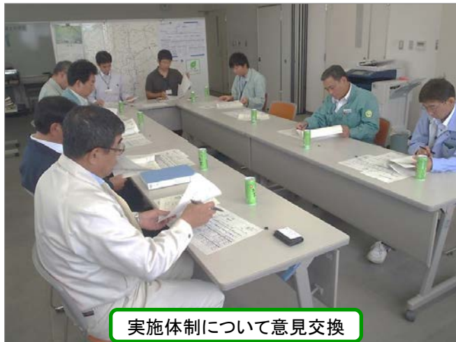
実施体制について意見交換

6月28日、石巻国道維持出張所と協定締結している地域の建設業6社の代表者による会議を開催しました。災害時の被災状況情報収集、建設資機材や人員の確保等について意見交換を行い、異常気象などにより発生する災害に備えています。