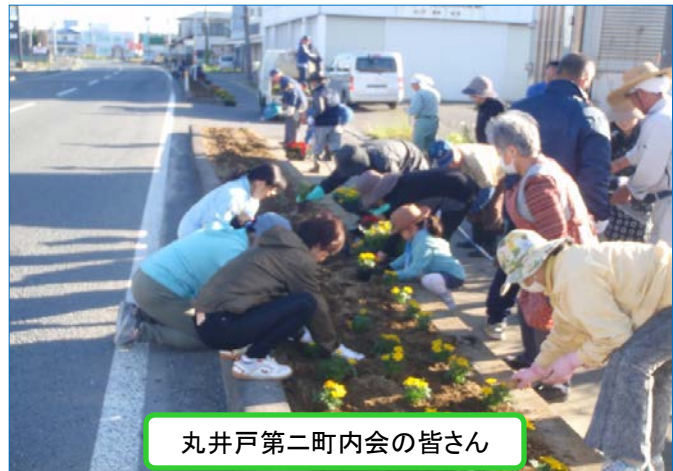
丸井戸第二町内会の皆さん