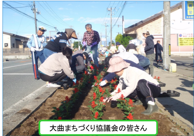
大曲まちづくり協議会の皆さん