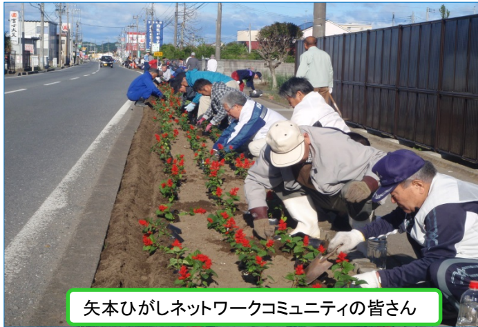
矢本ひがしネットワークコミュニティの皆さん