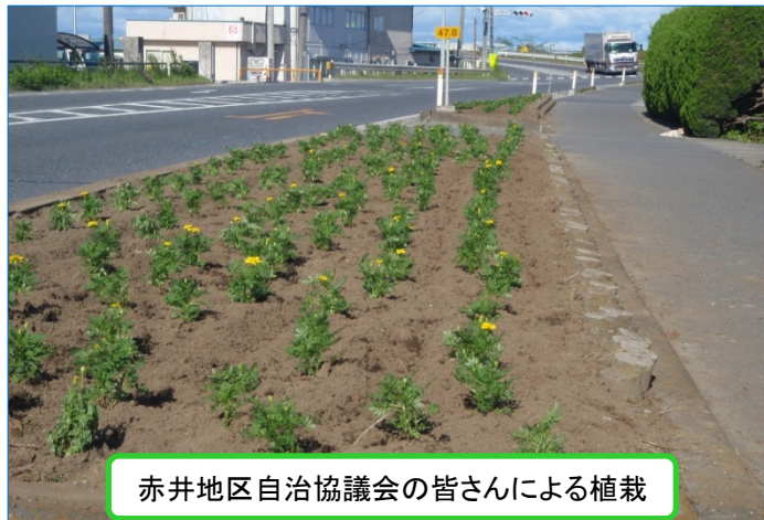
赤井地区自治協議会の皆さんによる植栽