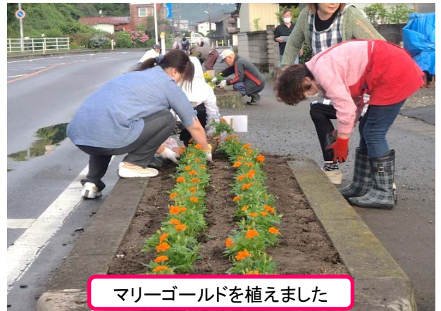
マリーゴールドを植えました