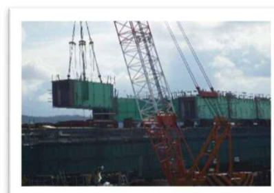
送出し桁架設状況