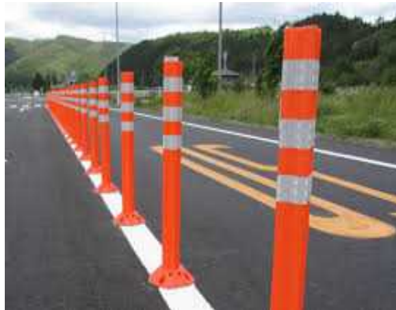
●ポールコーン新設