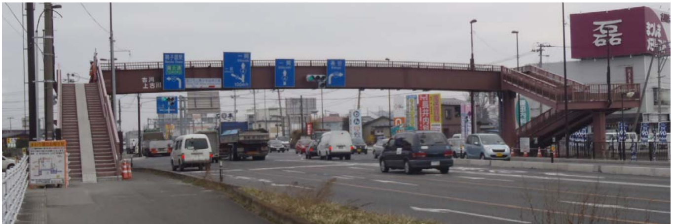
【上古川横断歩道橋 全景】