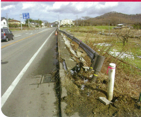
ガードレール・標識等の損傷