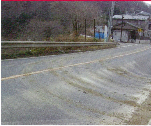
路面の汚れ(油・土砂)