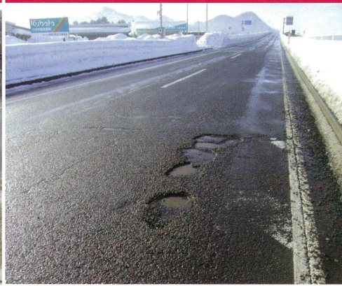
路面の穴ぼこ・段差