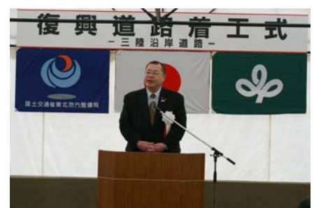
▲挨拶(国土交通省津島大臣政務官)