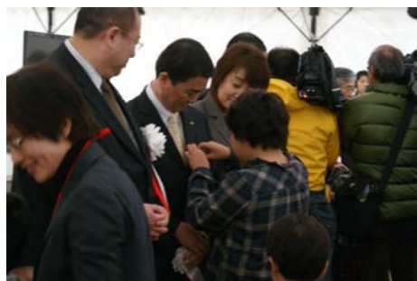
▲「命の道バッチ」贈呈