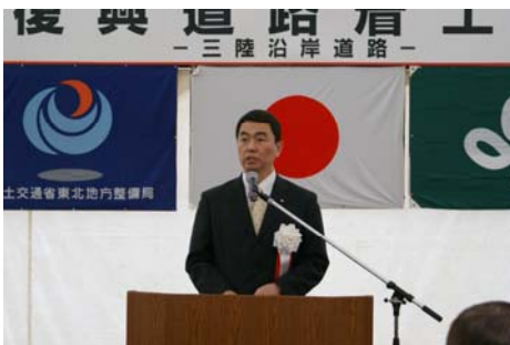
▲挨拶(宮城県村井知事)