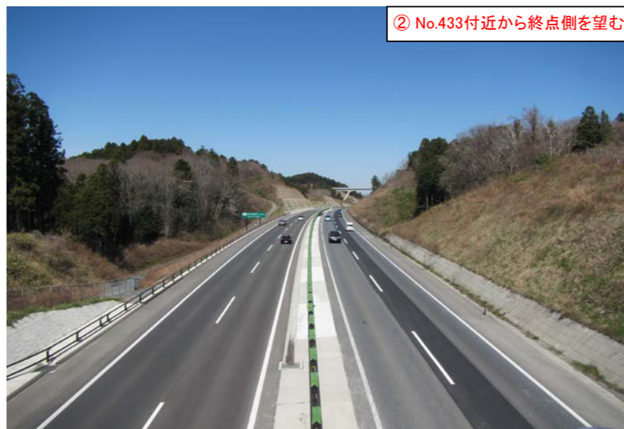
② No.433付近から終点側を望む