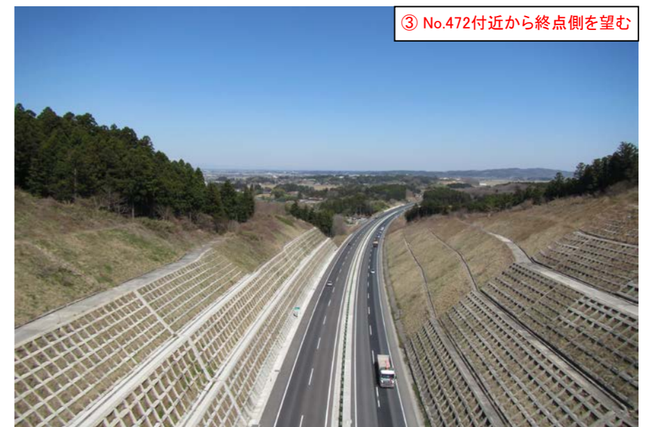
③ No.472付近から終点側を望む