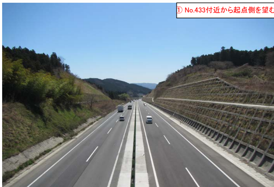
① No.433付近から起点側を望む