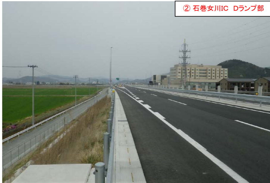
② 石巻女川IC Dランプ部