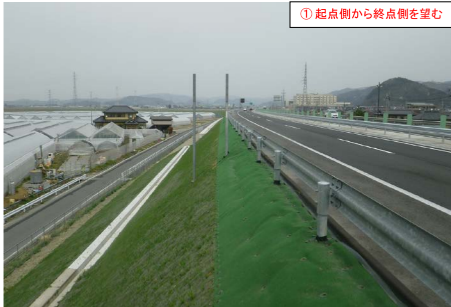
① 起点側から終点側を望む