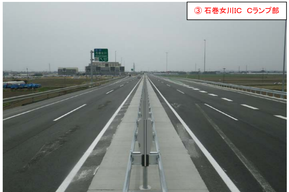
③ 石巻女川IC Cランプ部