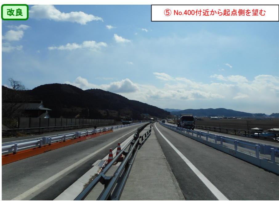
⑤ No.400付近から起点側を望む