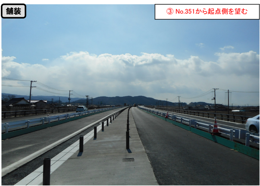
③ No.351から起点側を望む

太田南地区舗装工事 受注者：世紀東急工業株 工期：H28. 6. 29～H29. 3. 17