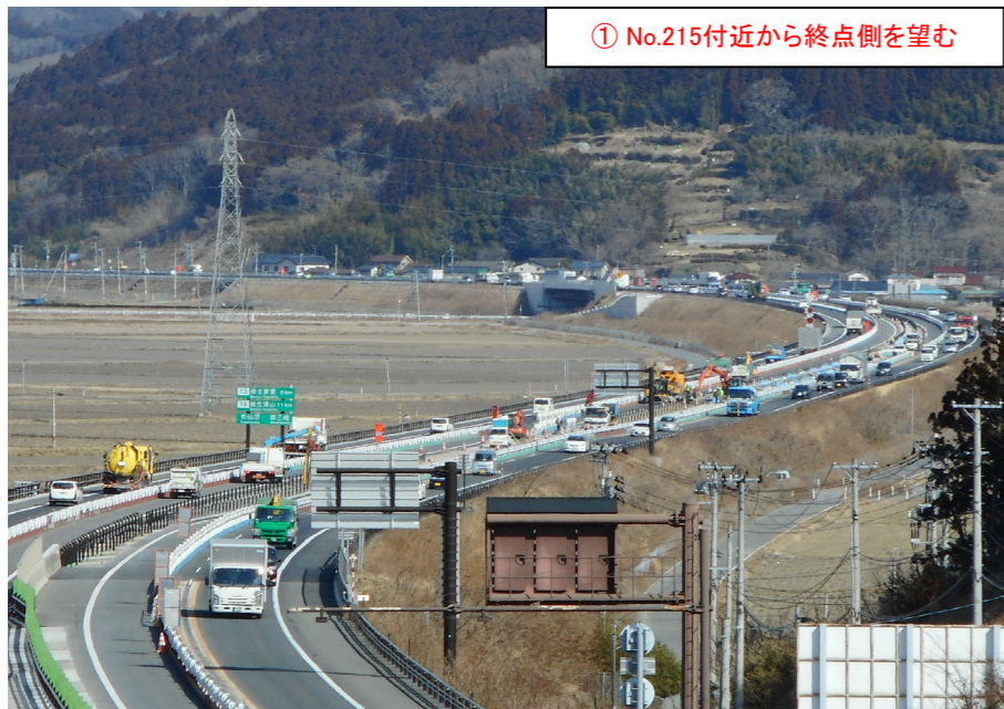
① No.215付近から終点側を望む