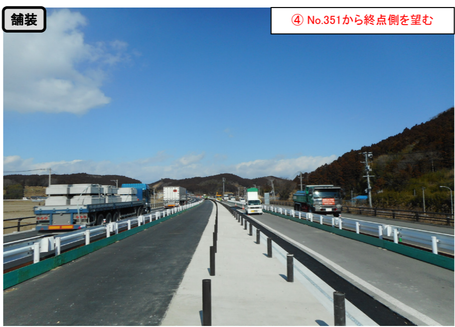
④ No.351から終点側を望む