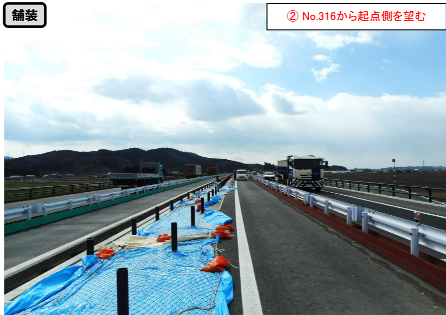
② No.316から起点側を望む