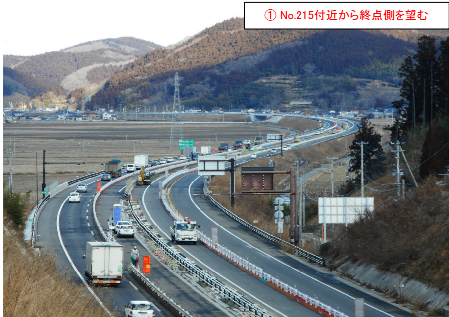
① No.215付近から終点側を望む