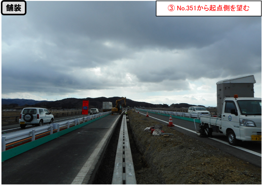
舗装 ③ No.351から起点側を望む