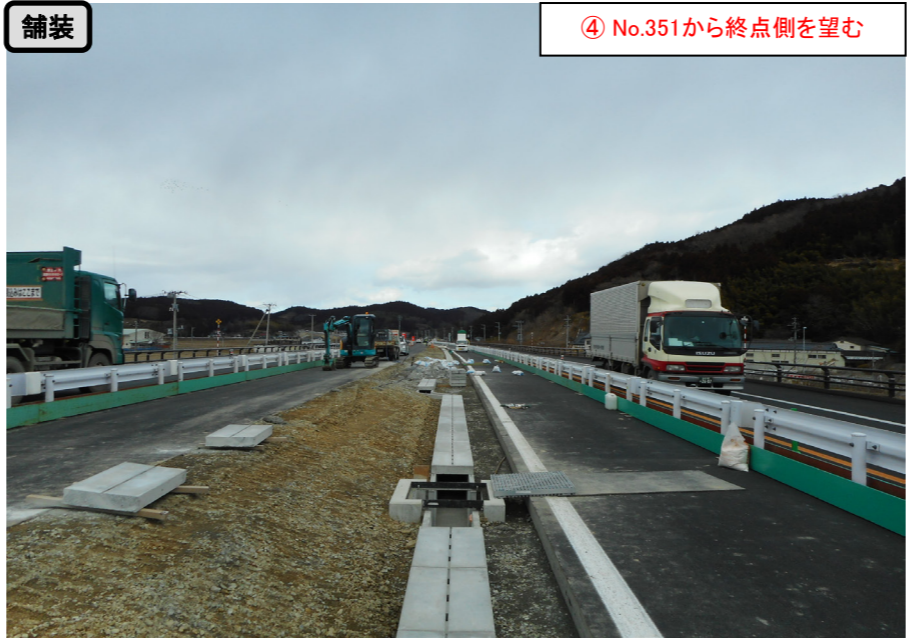
舗装 ④ No.351から終点側を望む