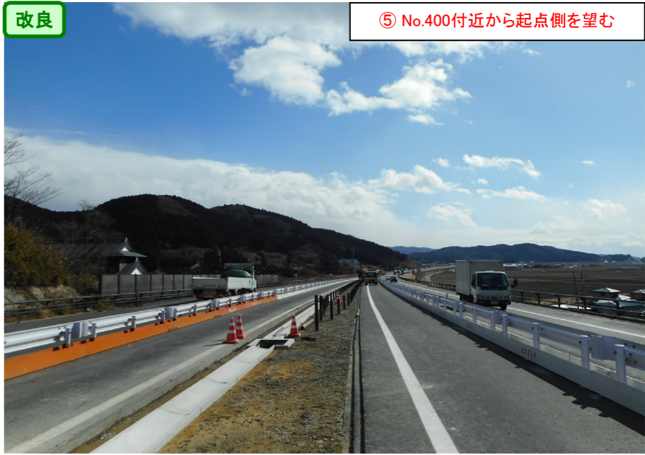
改良 ⑤ No.400付近から起点側を望む