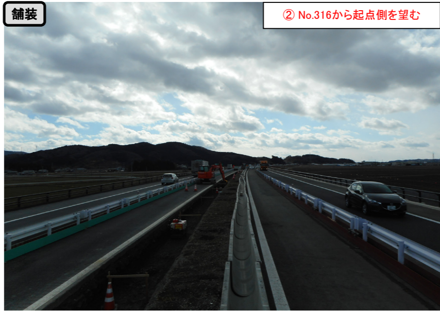
舗装 ② No.316から起点側を望む