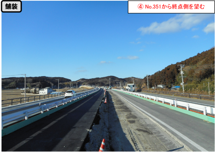
舗装 ④ No.351から終点側を望む