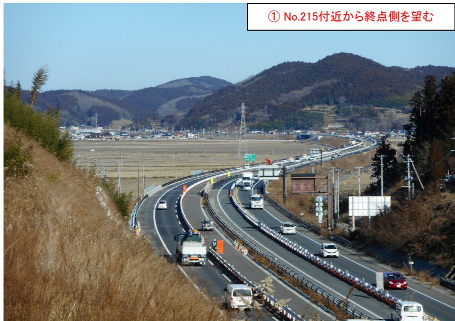
① No.215付近から終点側を望む