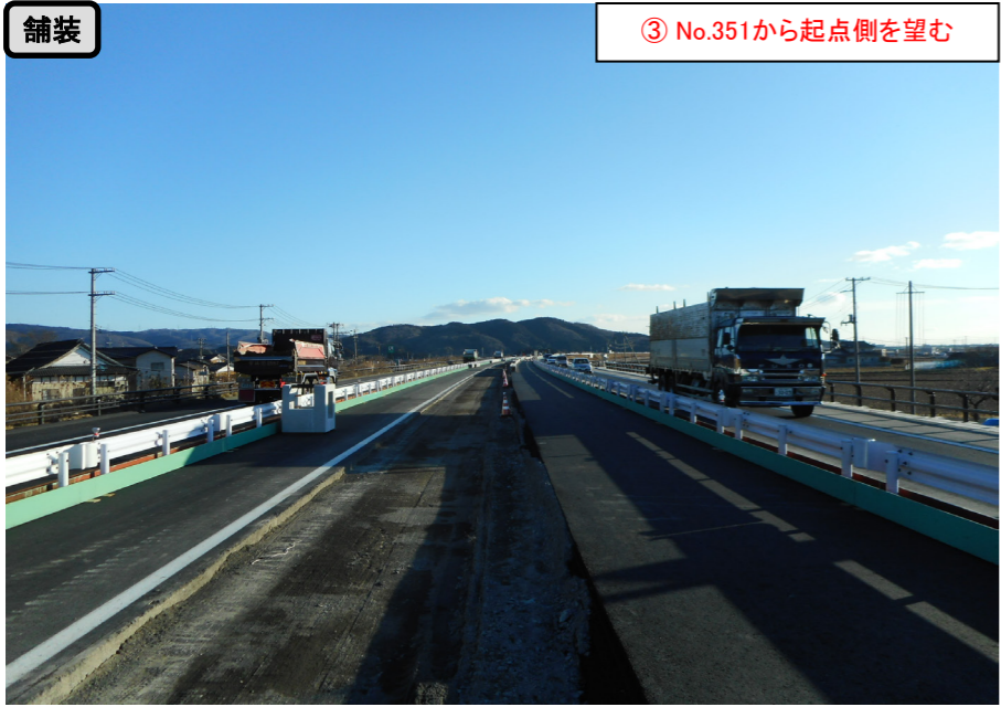
舗装 ③ No.351から起点側を望む

小船越地区舗装工事 受注者：大成ロテック株 工期：H28. 10. 1～H29. 3. 17