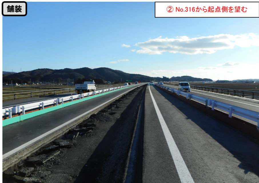
舗装 ② No.316から起点側を望む