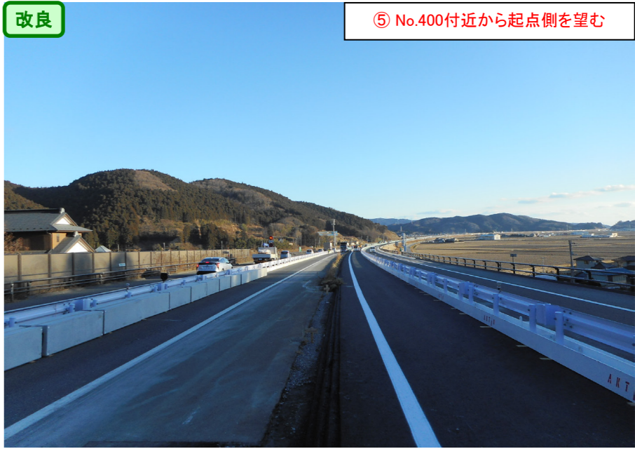
改良 ⑤ No.400付近から起点側を望む