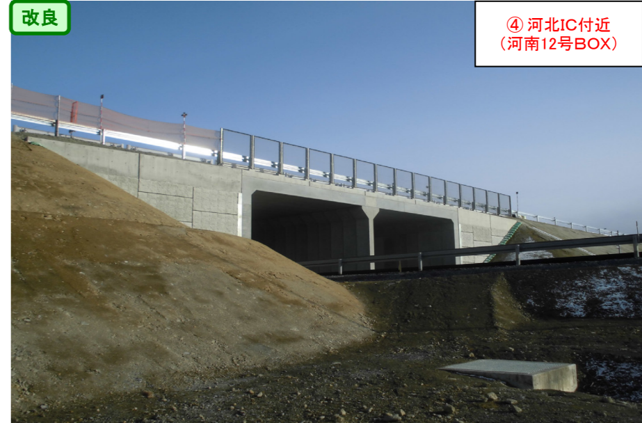
改良 ④ 河北IC付近 (河南12号BOX)