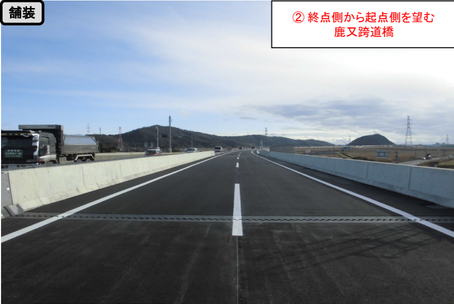
舗装 ② 終点側から起点側を望む 鹿又跨道橋

二子南上地区改良工事 受注者：株森組 工期：H28. 7. 16～H29. 2. 7