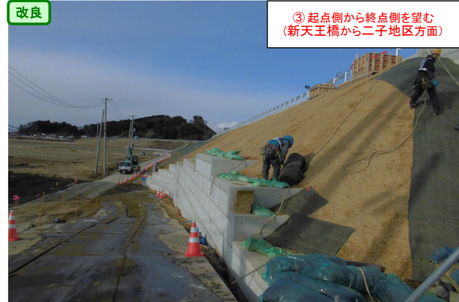
改良 ③ 起点側から終点側を望む (新天王橋から二子地区方面)