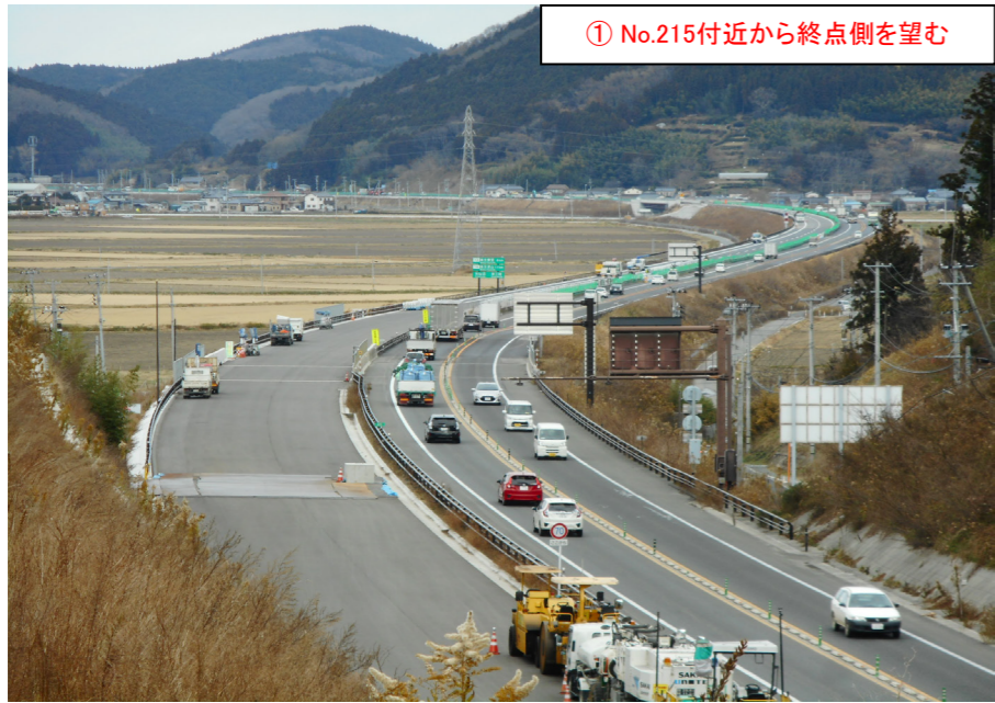
① No.215付近から終点側を望む