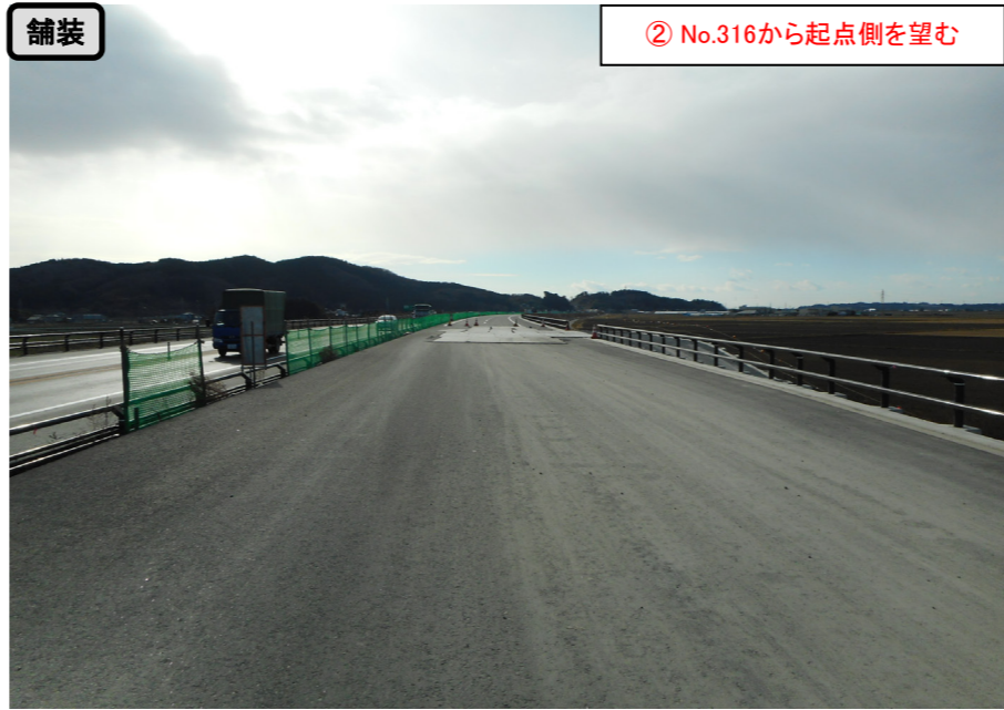
舗装 ② No.316から起点側を望む