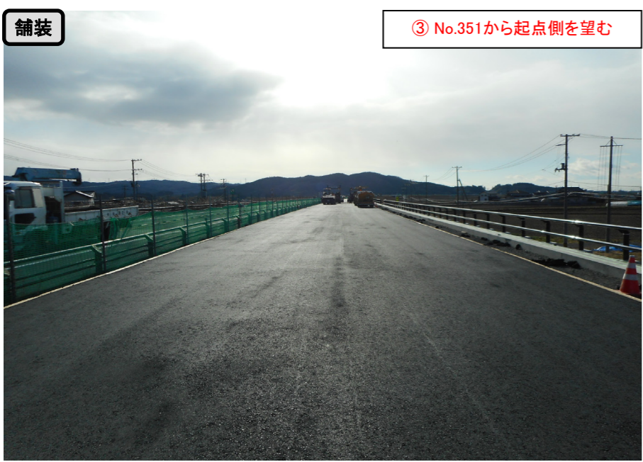
舗装 ③ No.351から起点側を望む

小島越地区舗装工事 受注者：大成ロテック株 工期：H28. 10. 1～H29. 3. 17