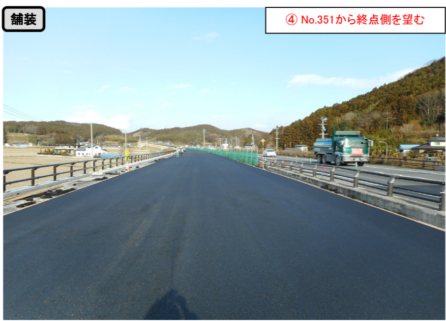
舗装 ④ No.351から終点側を望む