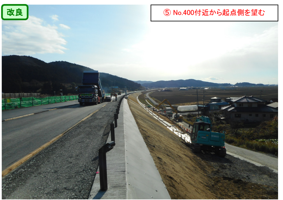
改良 ⑤ No.400付近から起点側を望む