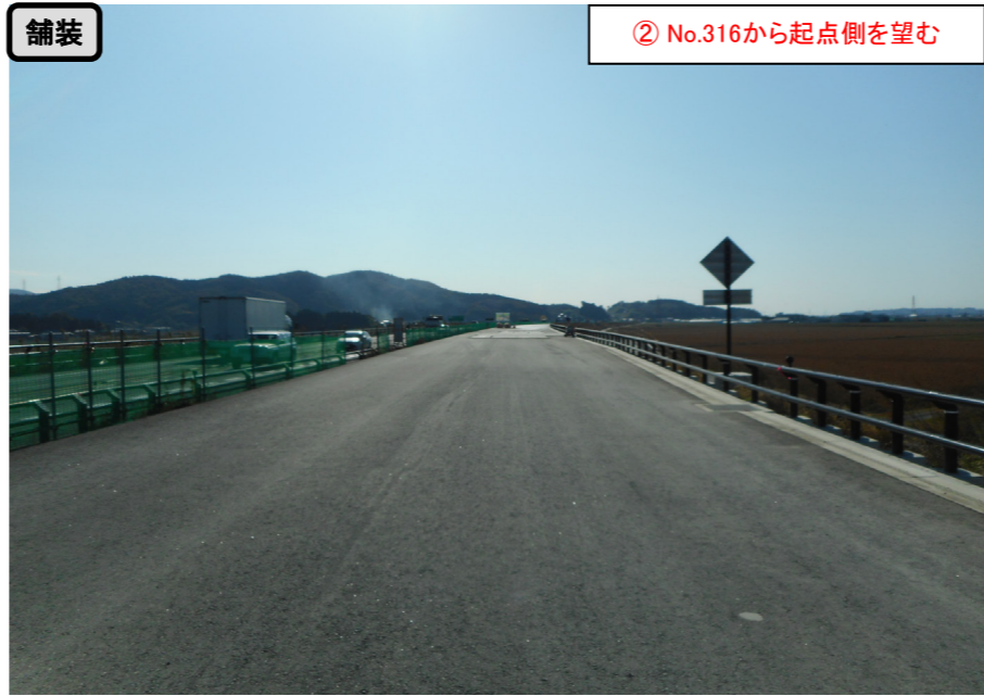
舗装 ② No.316から起点側を望む