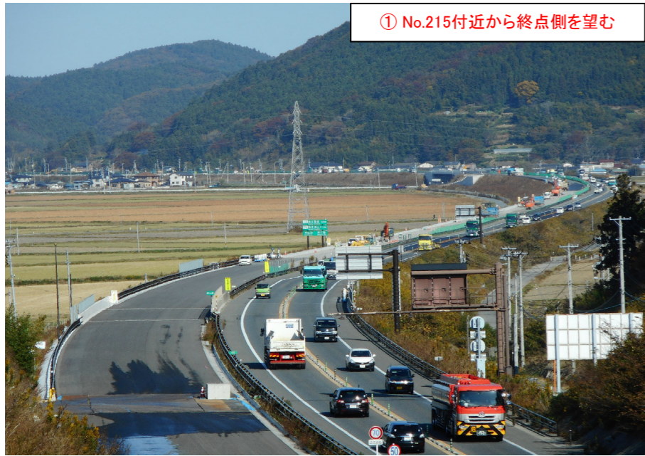
① No.215付近から終点側を望む