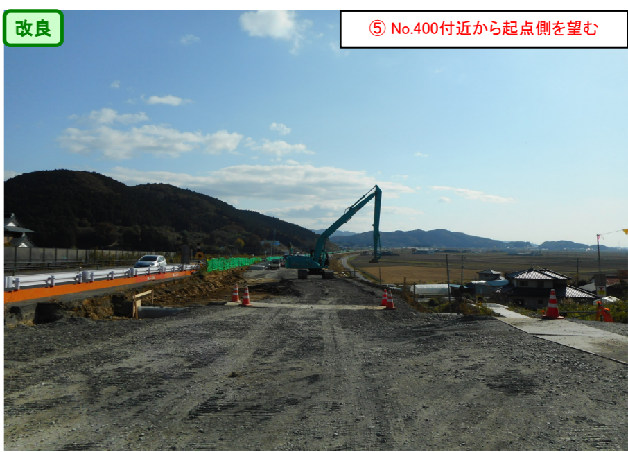
改良 ⑤ No.400付近から起点側を望む