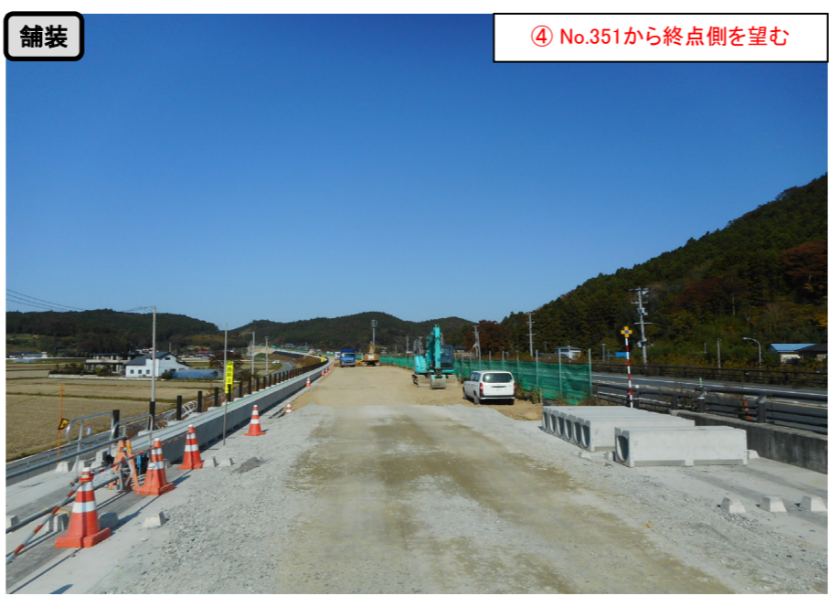
舗装 ④ No.351から終点側を望む