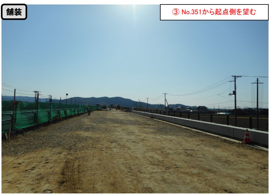
舗装 ③ No.351から起点側を望む

小船越地区舗装工事 受注者：大成ロテック株 工期：H28. 10. 1～H29. 3. 17