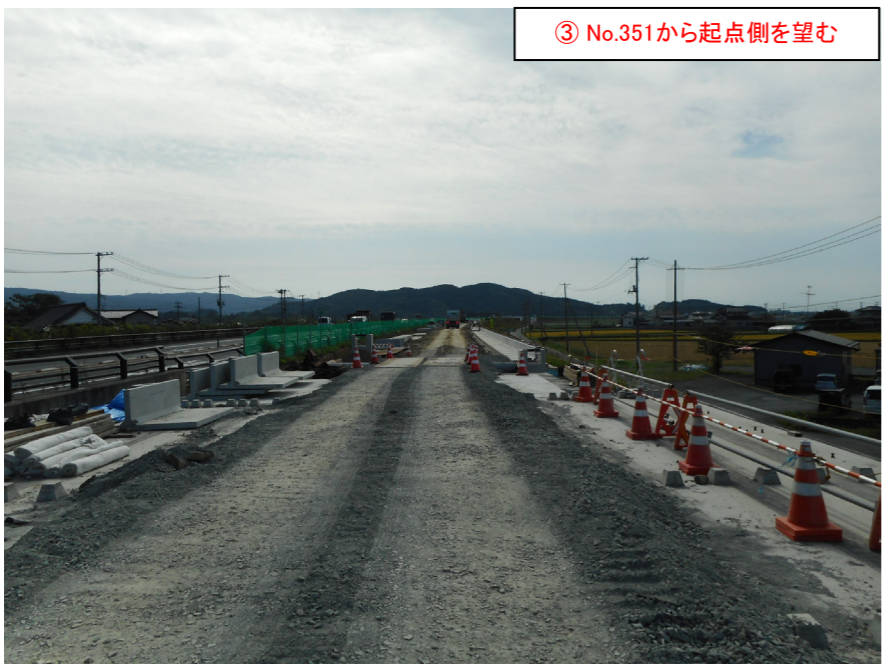
③ No.351から起点側を望む

小船越地区舗装工事 受注者：大成ロテック株 工期：H28. 10. 1～H29. 3. 17