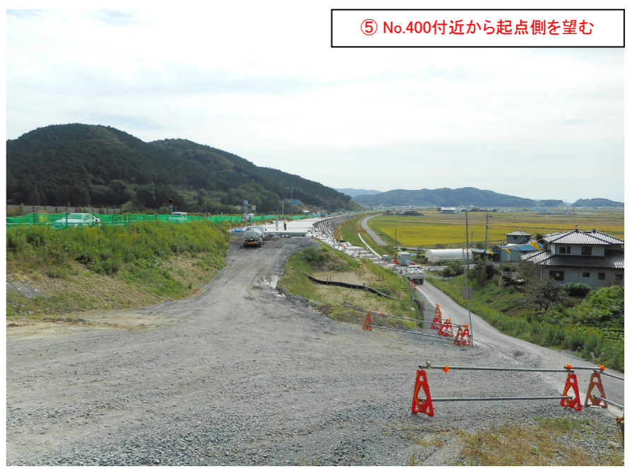
⑤ No.400付近から起点側を望む