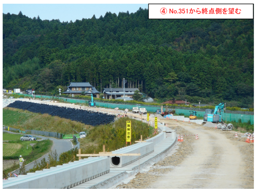
④ No.351から終点側を望む