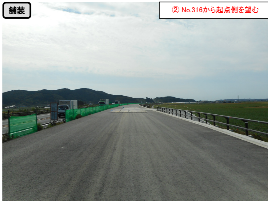
② No.316から起点側を望む