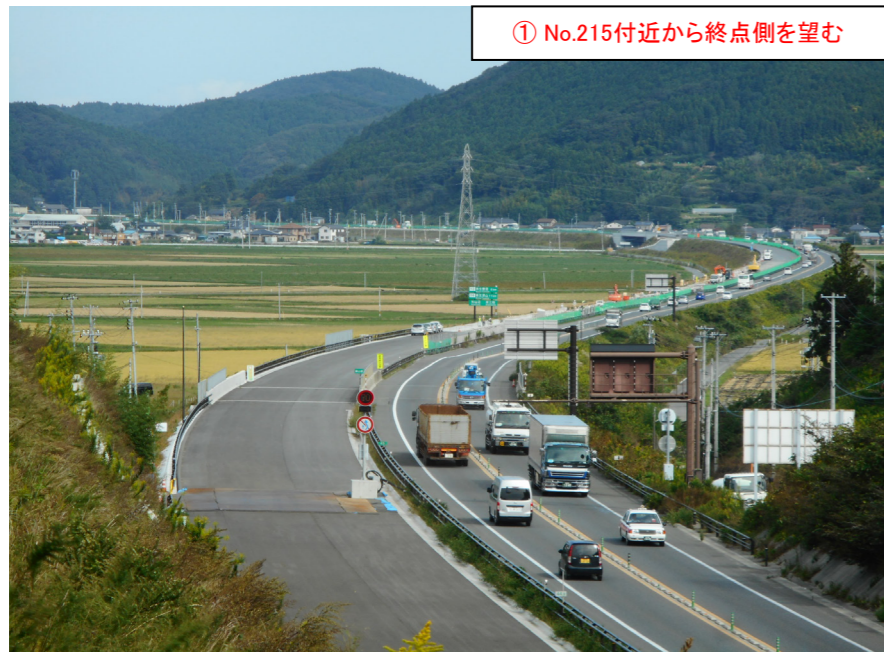
① No.215付近から終点側を望む