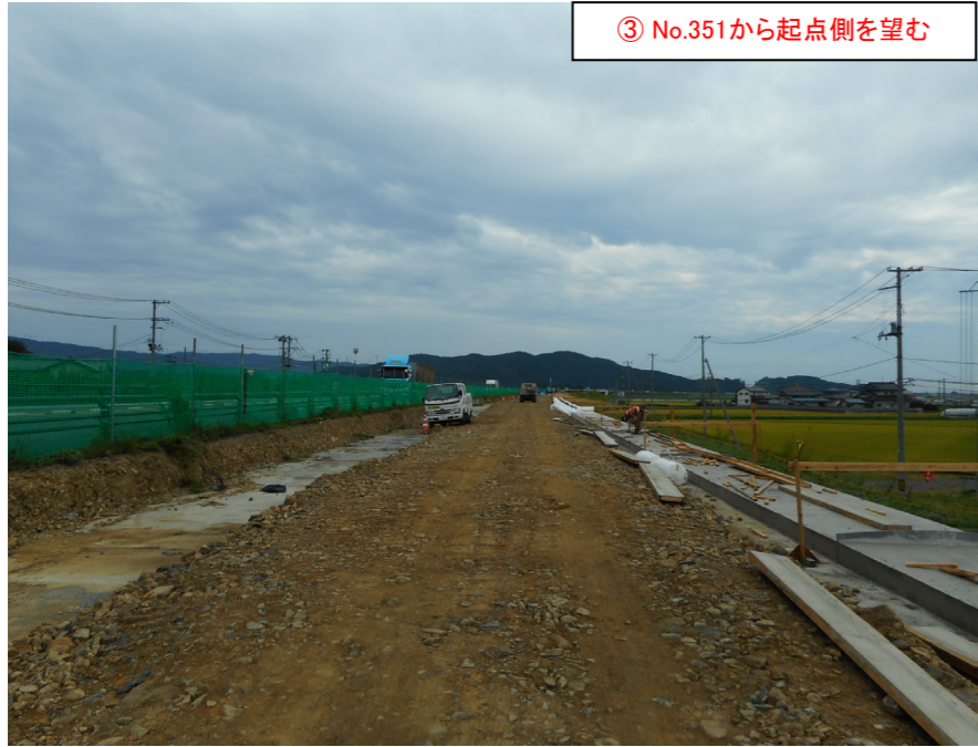
③ No.351から起点側を望む