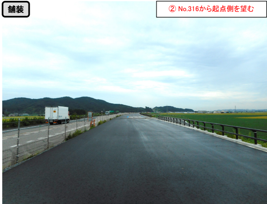
② No.316から起点側を望む