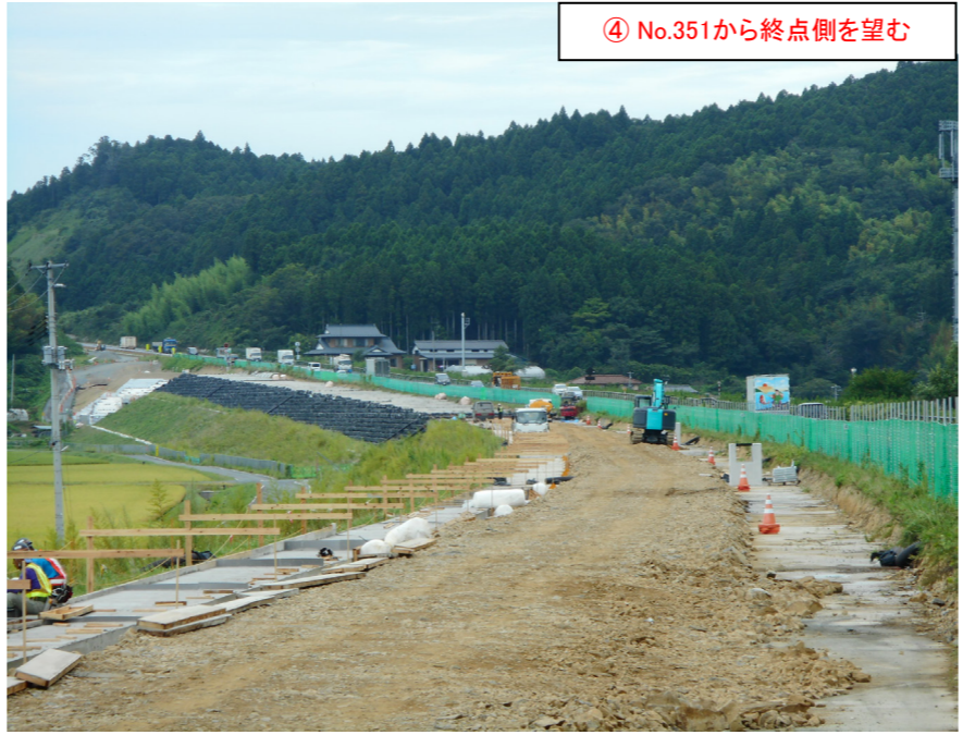
④ No.351から終点側を望む