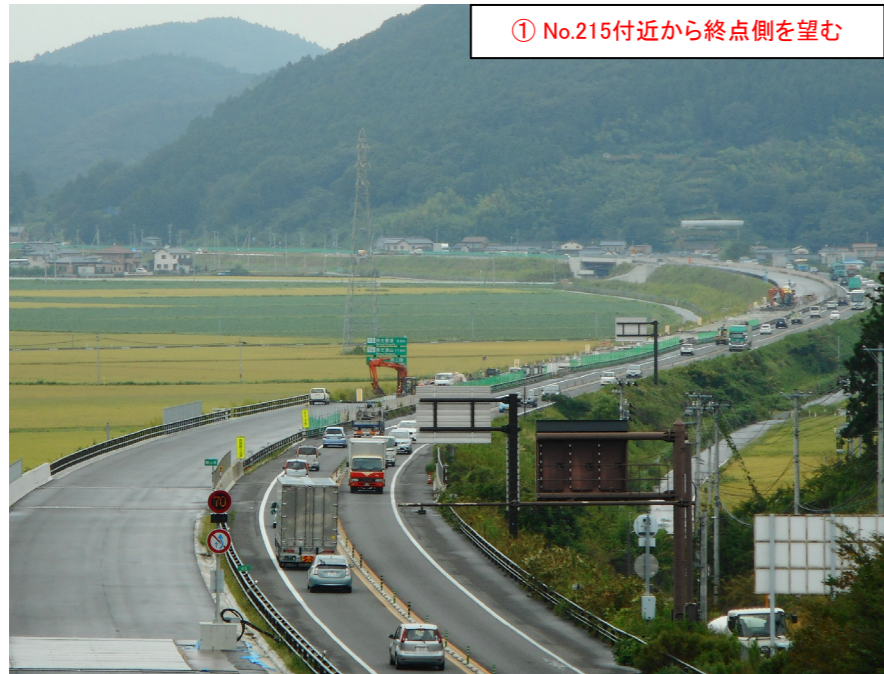
① No.215付近から終点側を望む