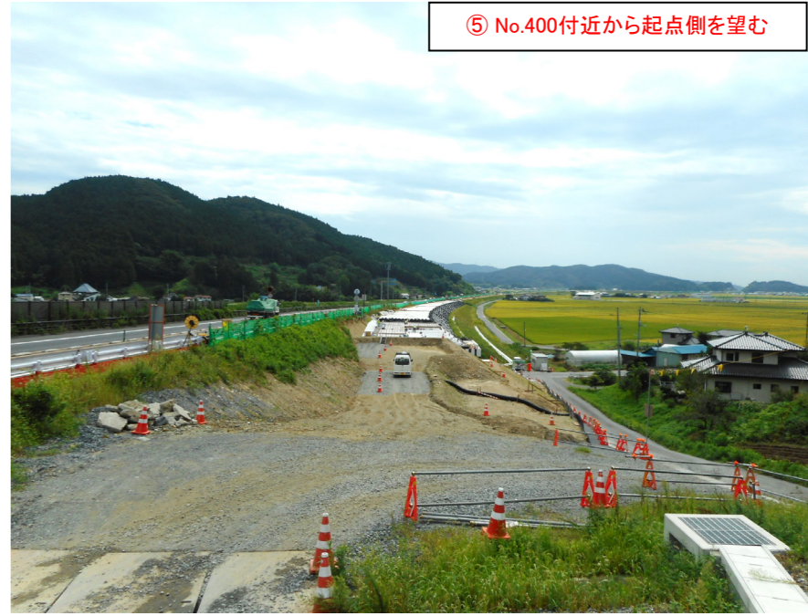
⑤ No.400付近から起点側を望む