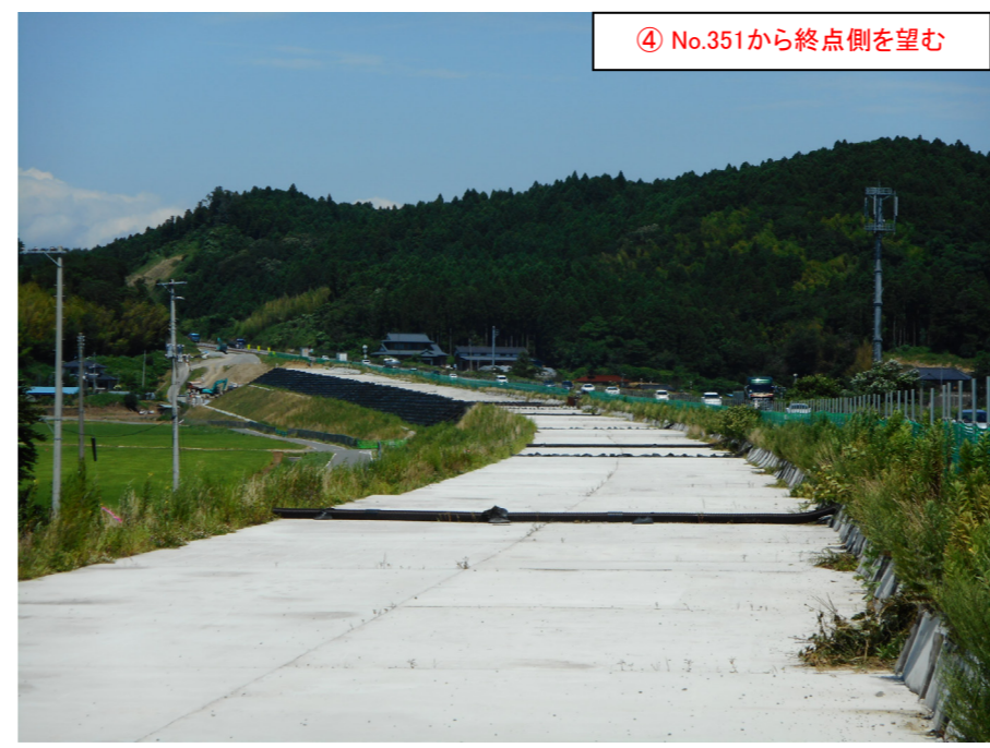
④ No.351から終点側を望む