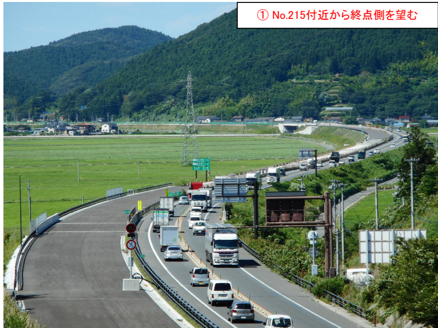
① No.215付近から終点側を望む