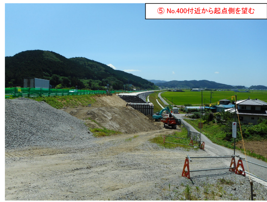
⑤ No.400付近から起点側を望む