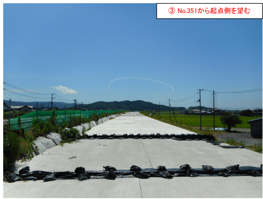
③ No.351から起点側を望む