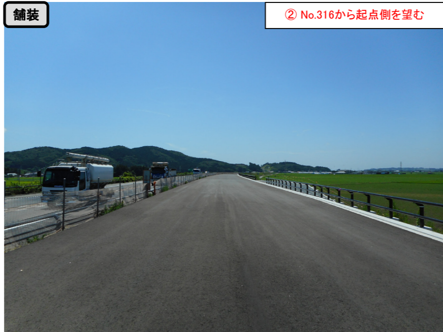
舗装 ② No.316から起点側を望む