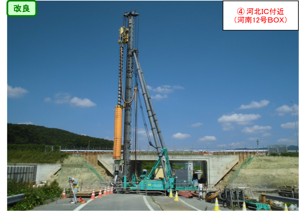
④ 河北IC付近 (河南12号BOX)