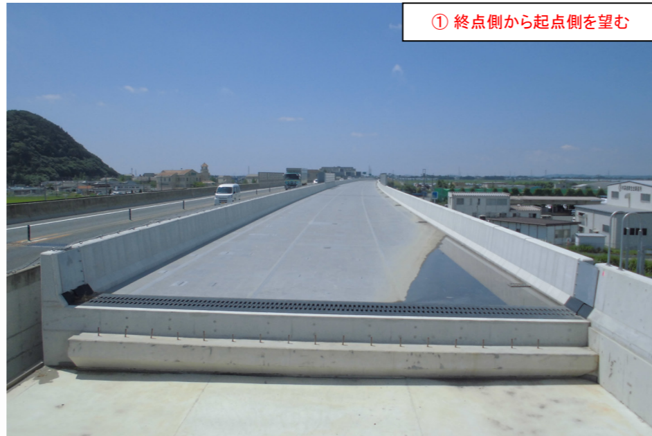
① 終点側から起点側を望む

曾波神地区舗装工事 受注者：鹿島道路株 工期：H28. 6. 28～H29. 3. 10