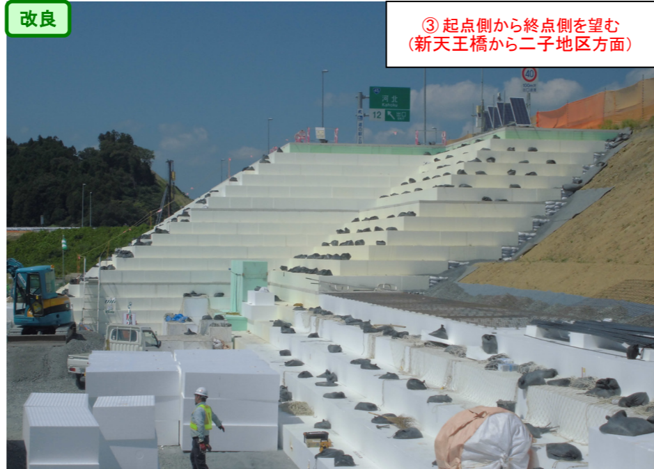
③ 起点側から終点側を望む (新天王橋から二子地区方面)