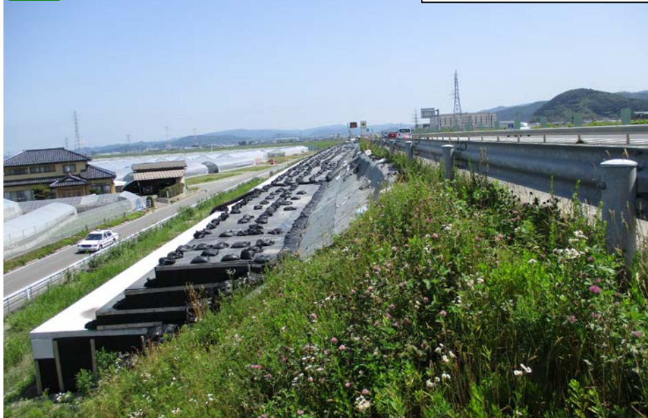
① 起点側から終点側を望む