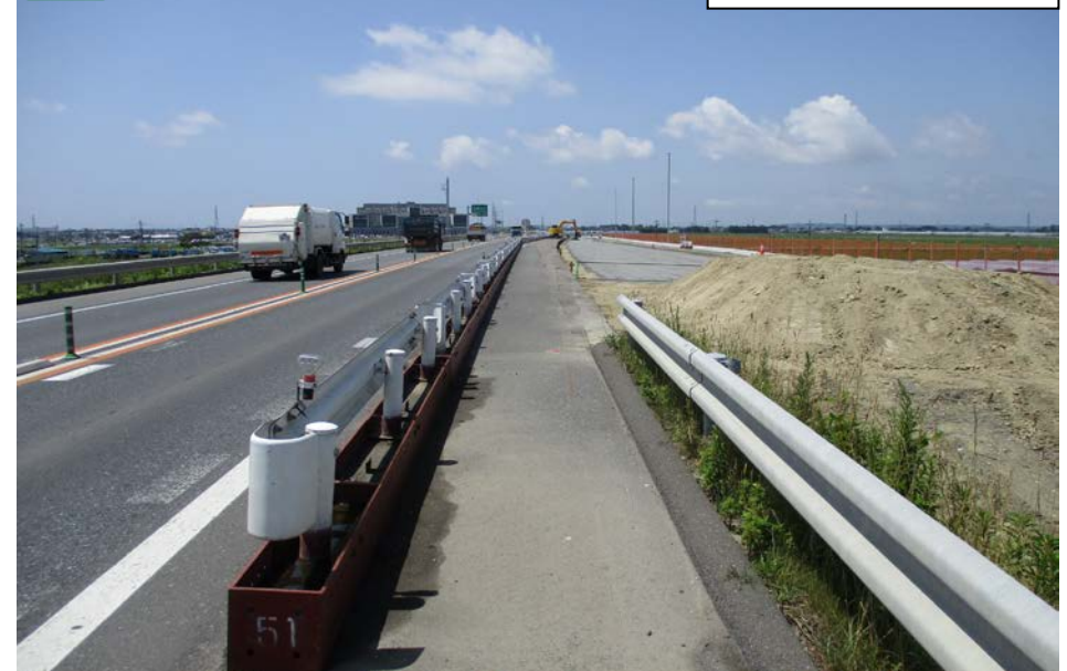
③ 石巻女川IC Cランプ部