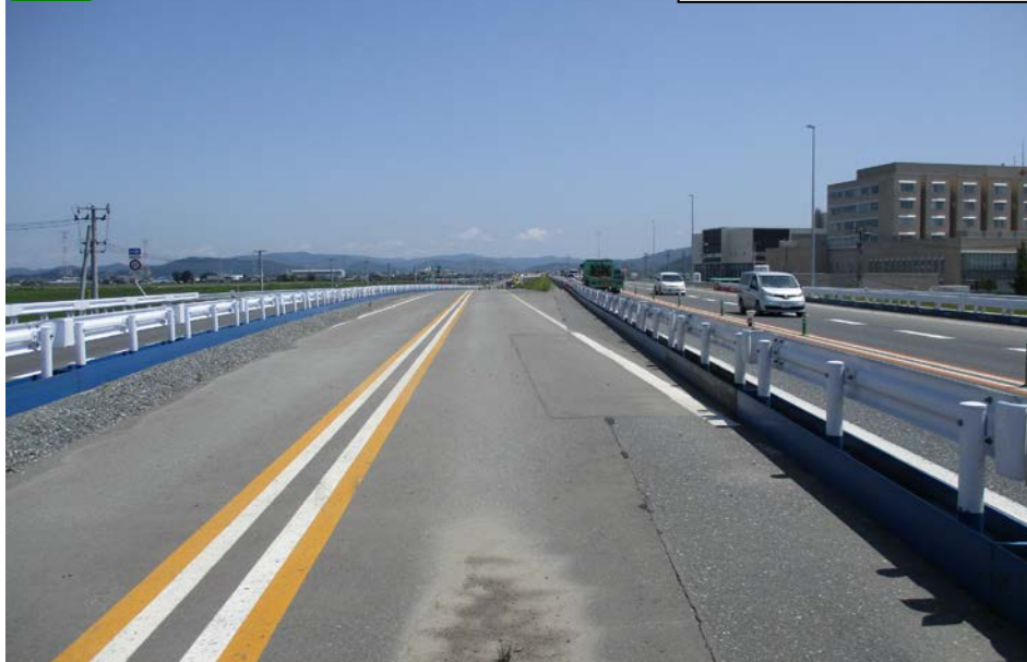
② 石巻女川IC Dランプ部