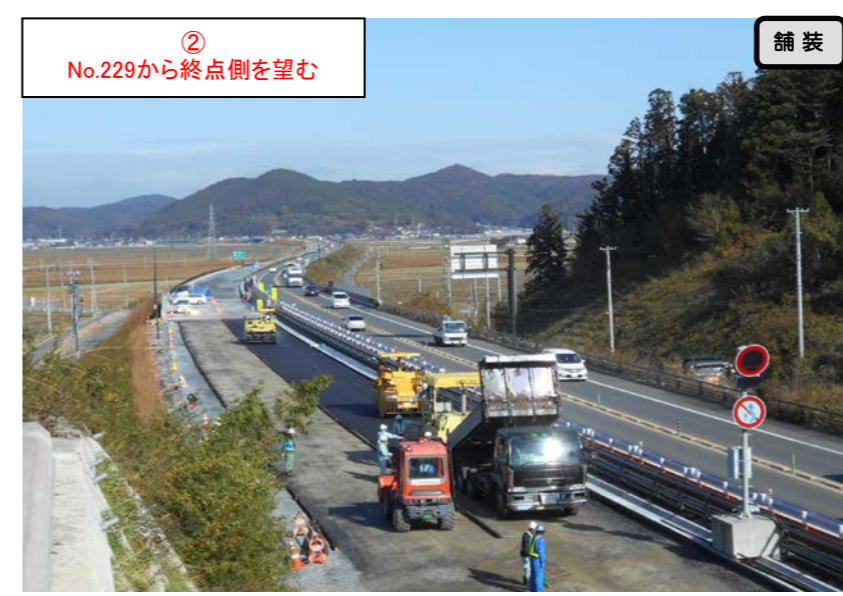
② No.229から終点側を望む