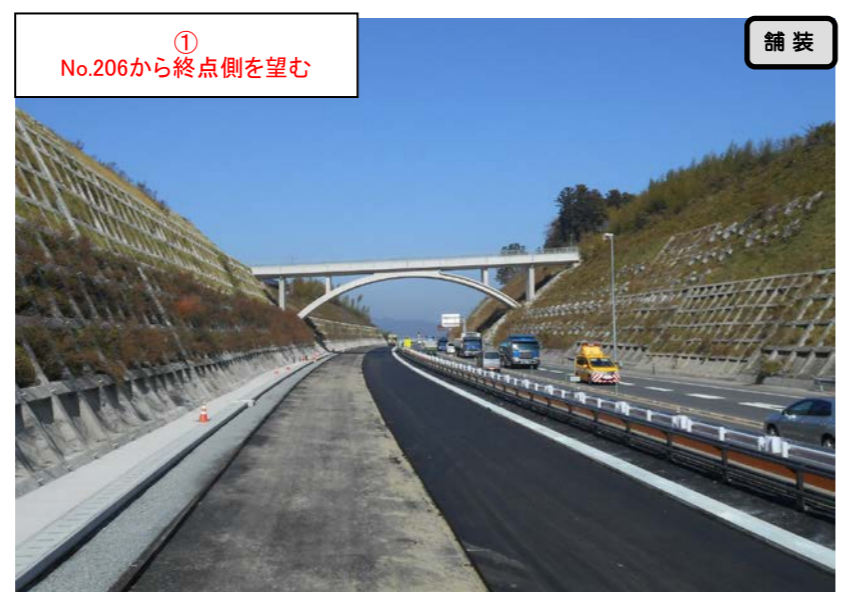
① No.206から終点側を望む