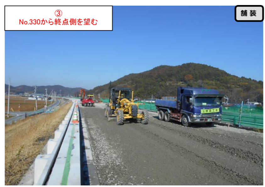
③ No.330から終点側を望む