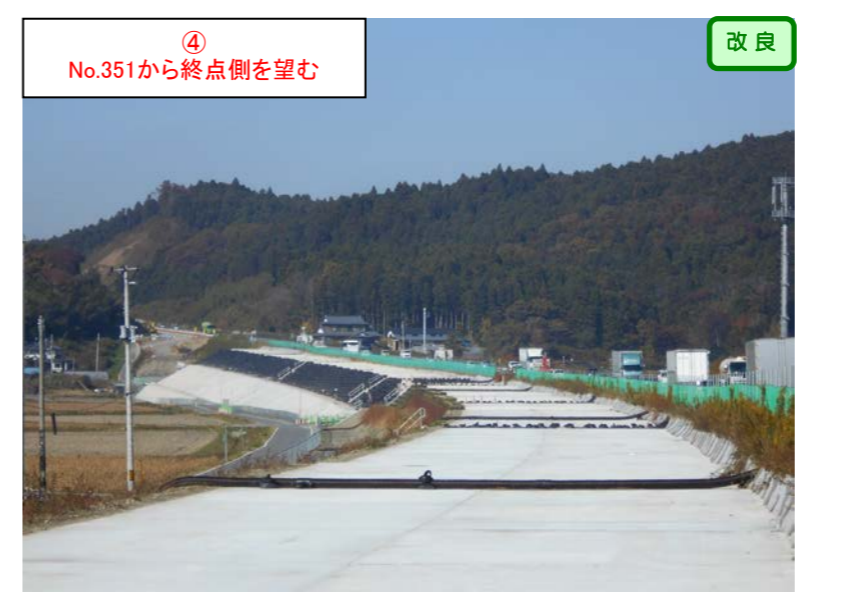
④ No.351から終点側を望む