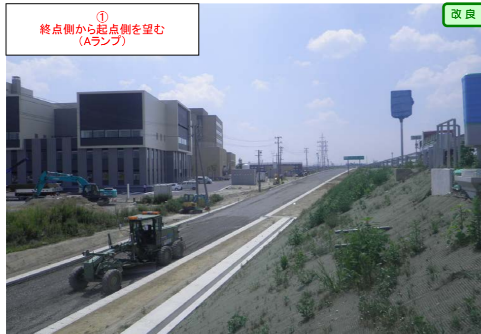
① 終点側から起点側を望む (Aランプ)

< 石巻河南IC～桃生豊里ICの延長14.1kmの4車線化(上り線リフレッシュ工事中) >