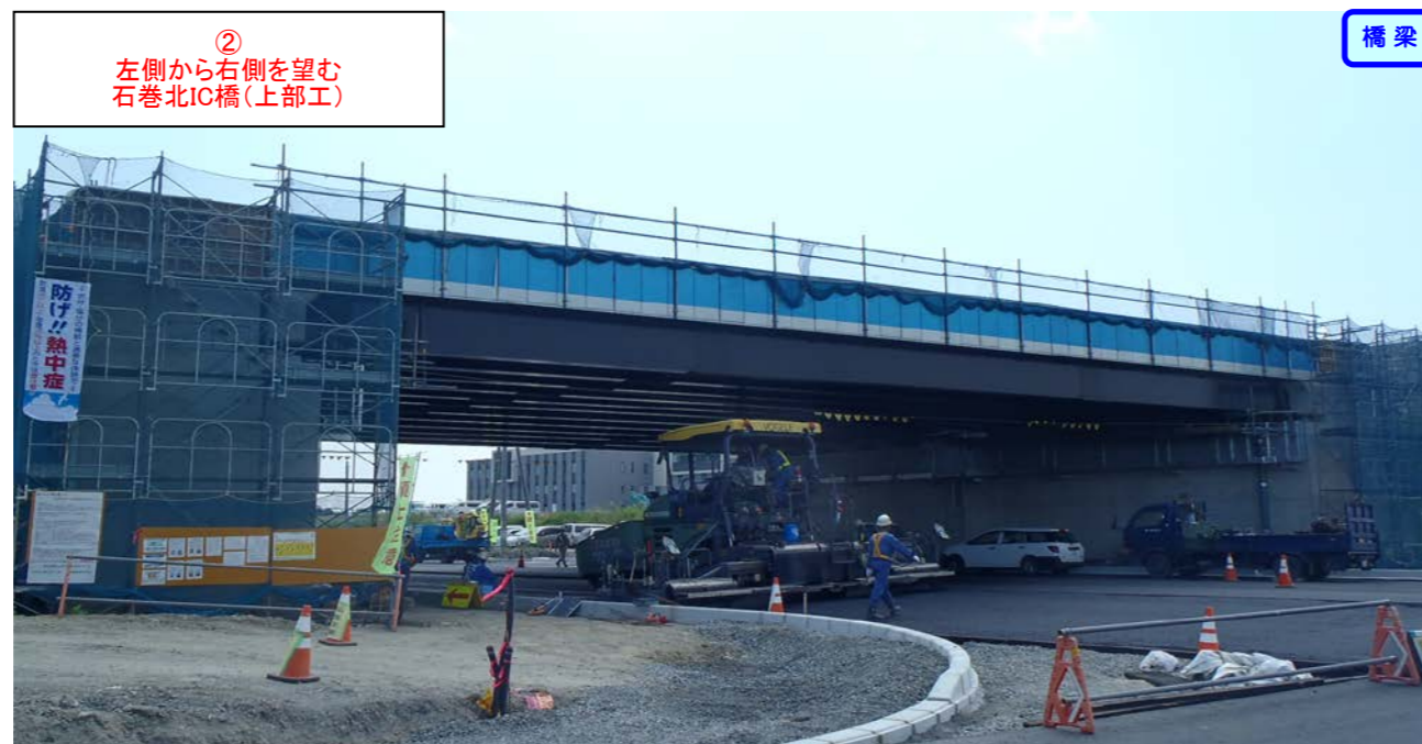
② 左側から右側を望む 石巻北IC橋(上部工)