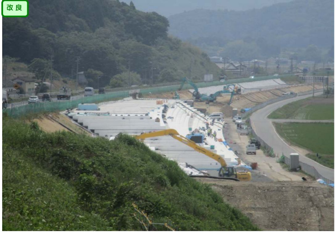
② No.435から終点側を望む