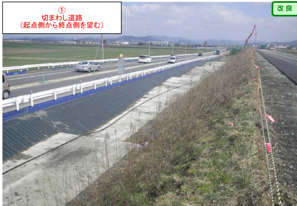
① 切まわし道路 (起点側から終点側を望む)

< 鳴瀬奥松島IC～石巻河南ICの延長12.4kmを4車線化事業中(2車線無料供用中) >