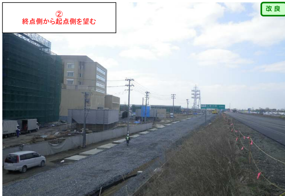
② 終点側から起点側を望む