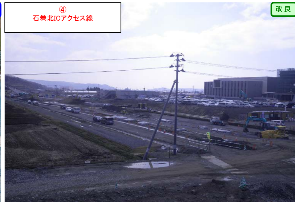
④ 石巻北ICアクセス線