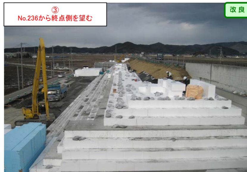
国道45号 矢本石巻道路改良工事 受注者：大成建設(株) 工期：H25. 3. 1～H27. 3. 27