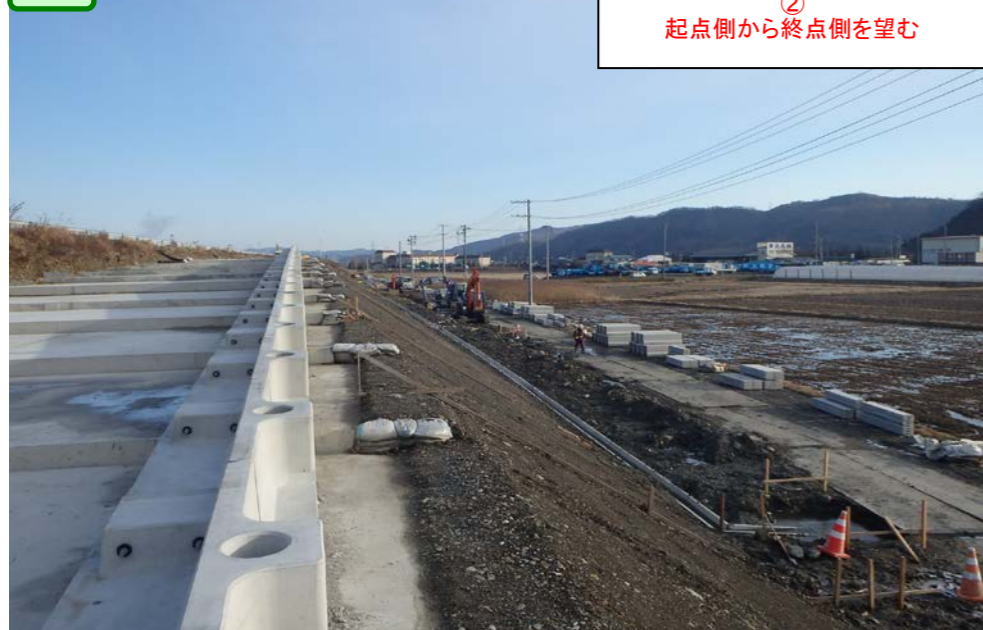
② 起点側から終点側を望む