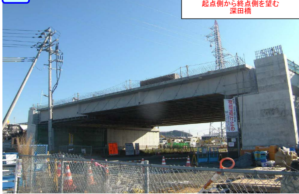
① 起点側から終点側を望む 深田橋