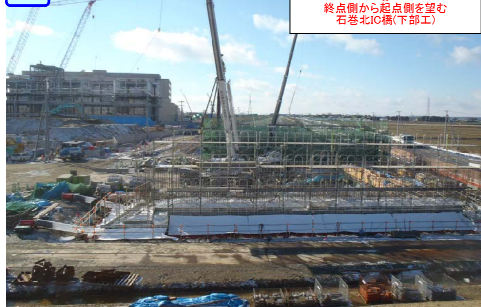
③ 終点側から起点側を望む 石巻北IC橋(下部工)