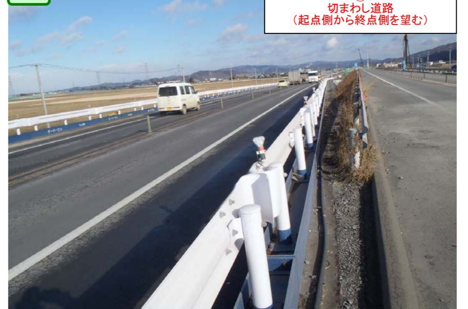
④ 切まわし道路 (起点側から終点側を望む)