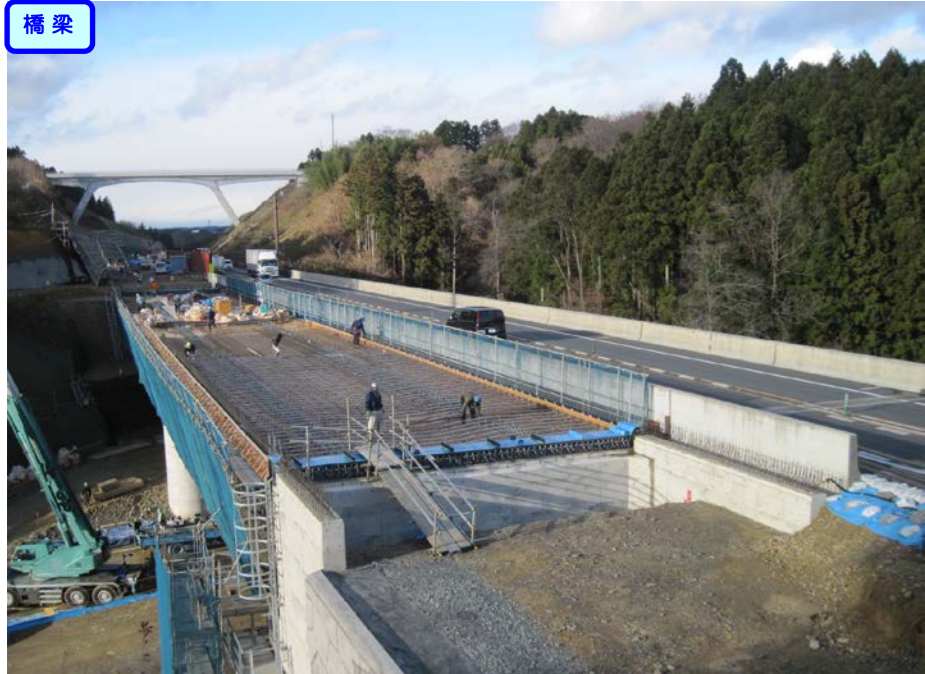
③ No.472から終点側を望む