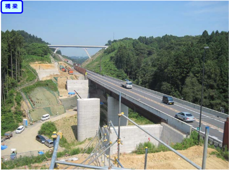
③ No.472から終点側を望む