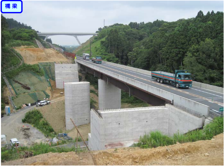
③ No.472から終点側を望む