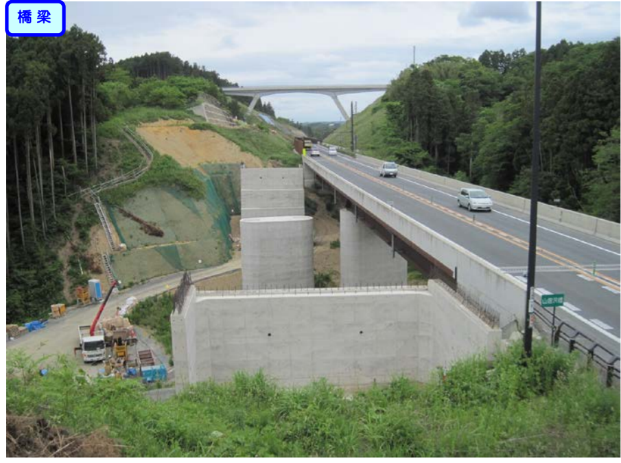
③ No.472から起点側を望む