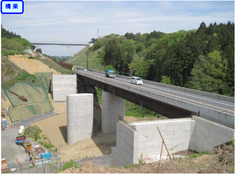
③ No.472から終点側を望む