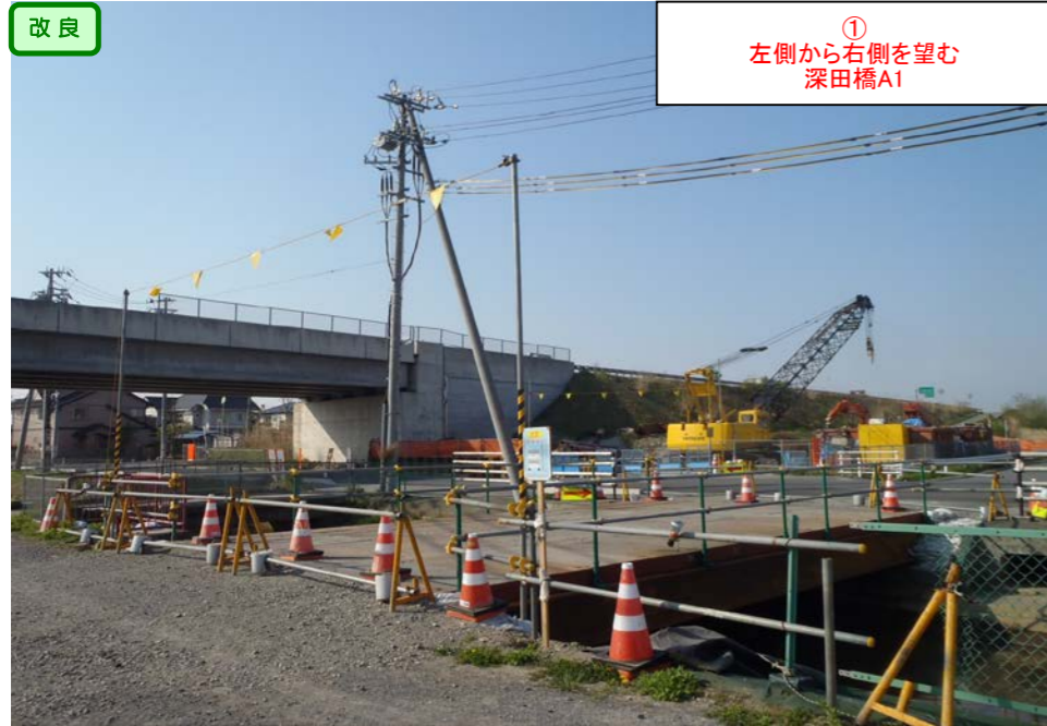
① 左側から右側を望む 深田橋A1