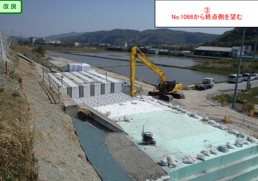
③ No.1066から終点側を望む