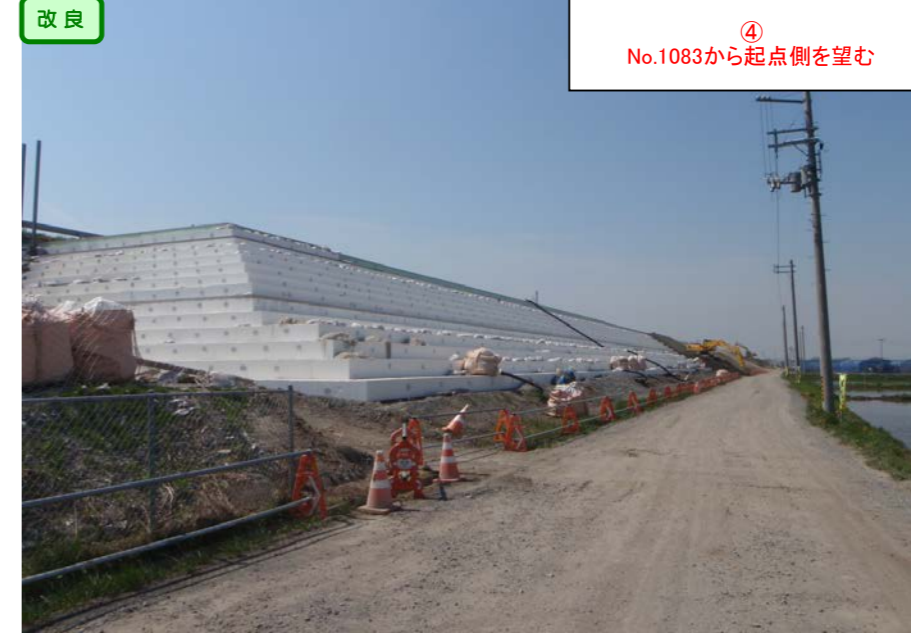
④ No.1083から起点側を望む