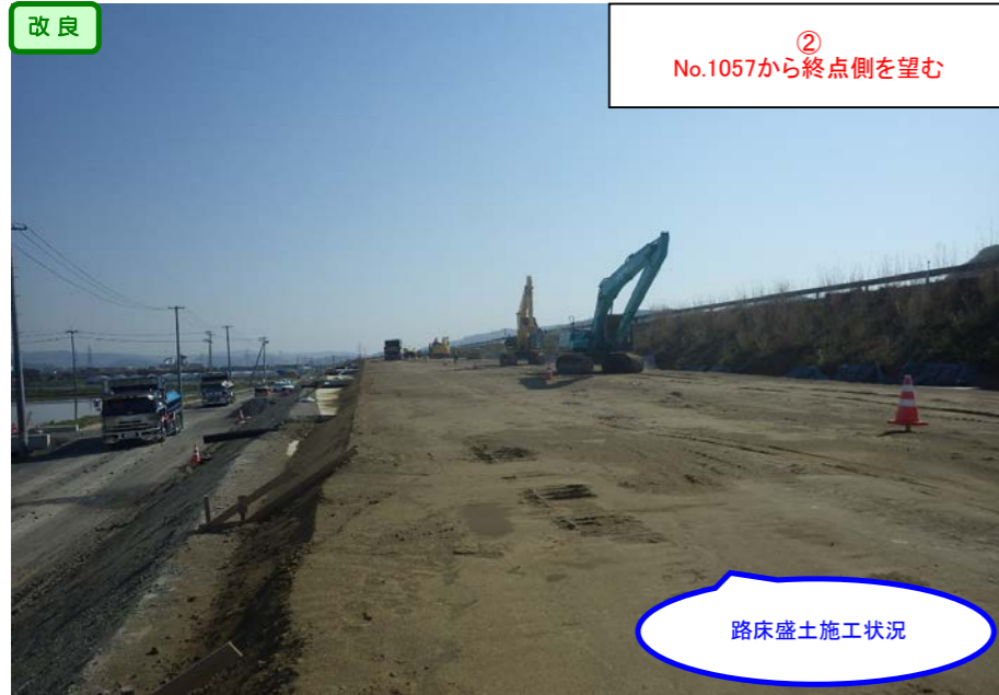
② No.1057から終点側を望む