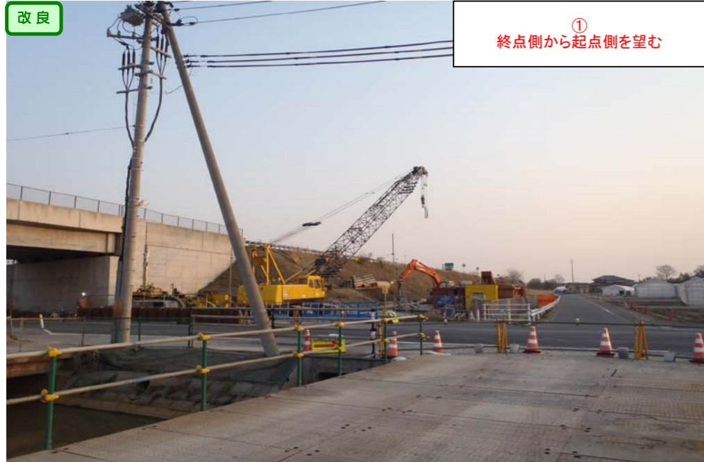
① 終点側から起点側を望む

< 鳴瀬奥松島IC～石巻河南ICの延長12.4kmを4車線化事業中(2車線無料供用中) >