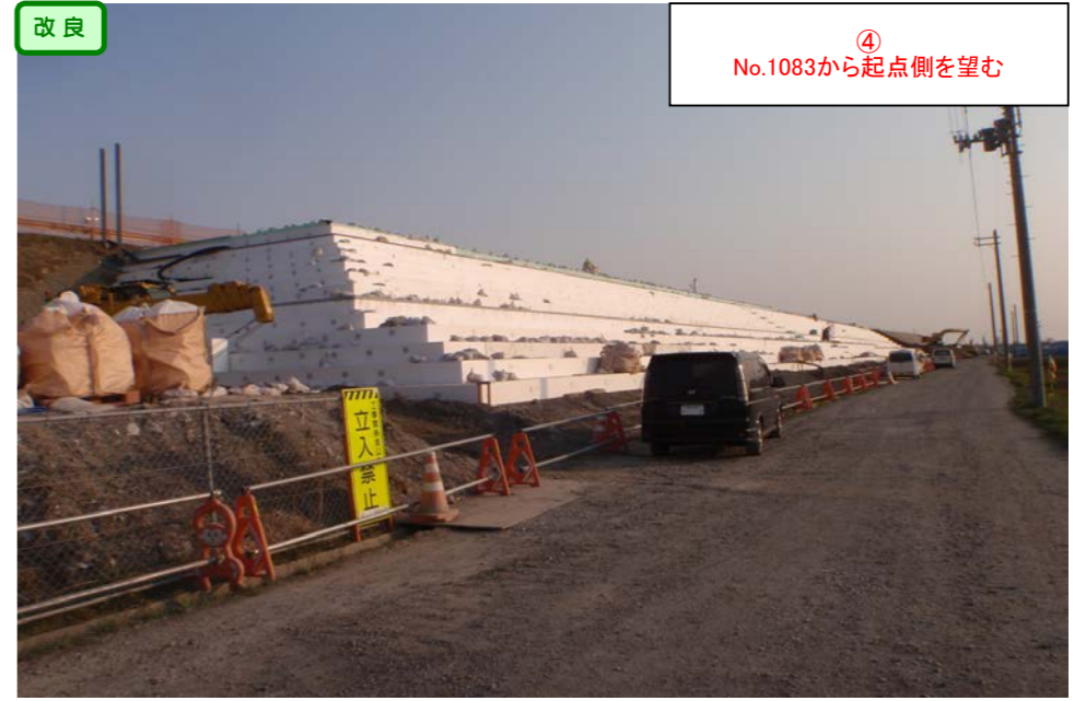
④ No.1083から起点側を望む