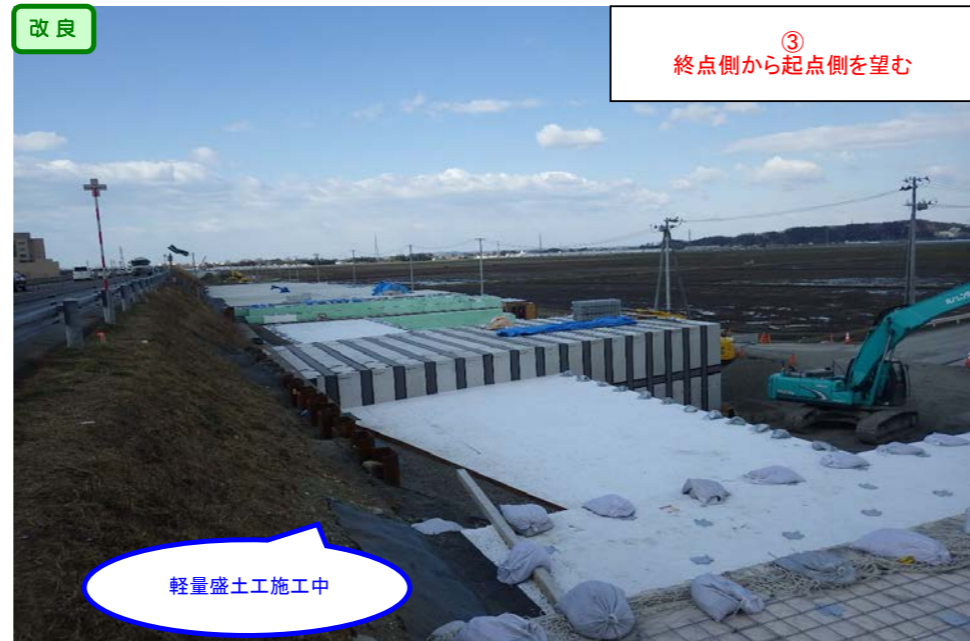
③ 終点側から起点側を望む