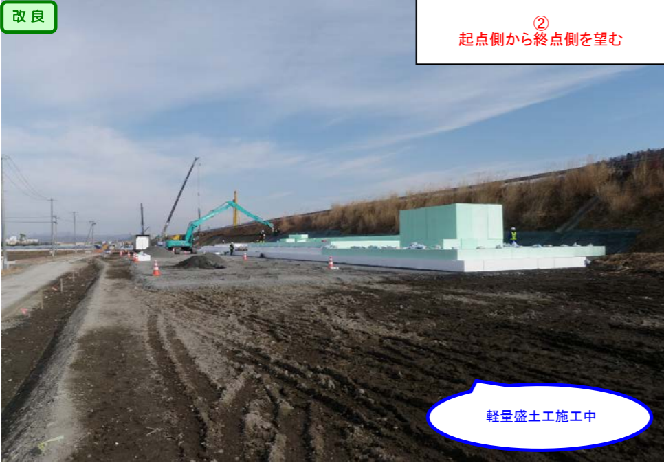
② 起点側から終点側を望む