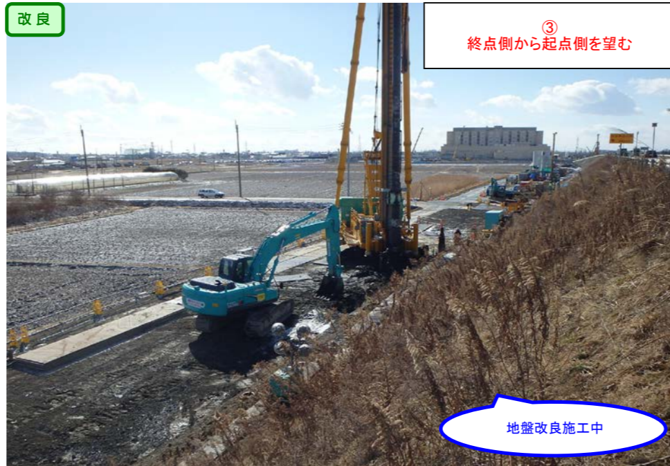
③ 終点側から起点側を望む