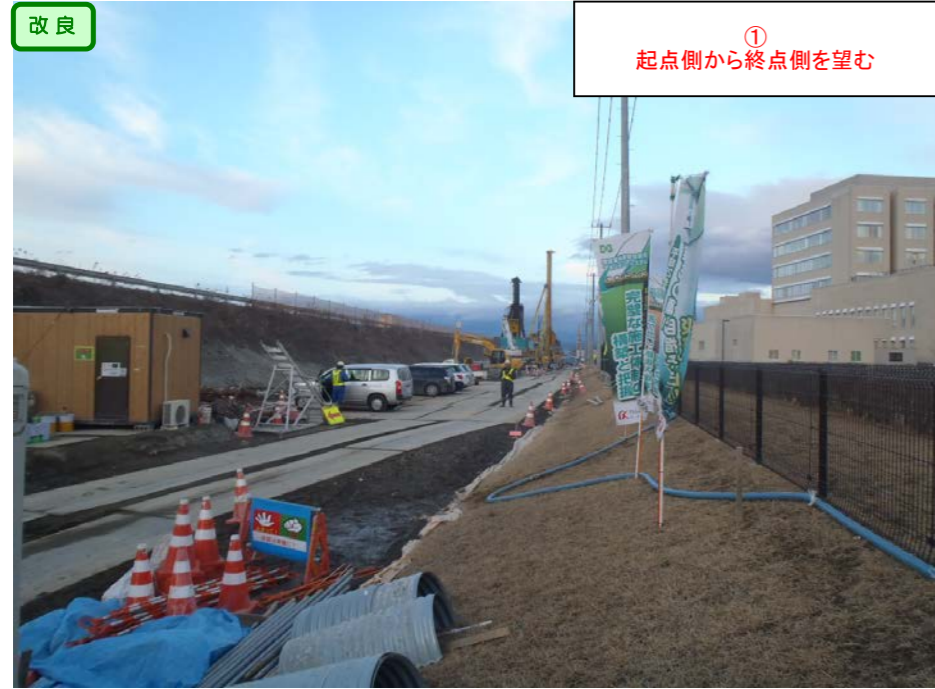
① 起点側から終点側を望む

＜ 鳴瀬奥松島IC～石巻河南ICの延長12.4kmを4車線化事業中(2車線無料共用中) ＞