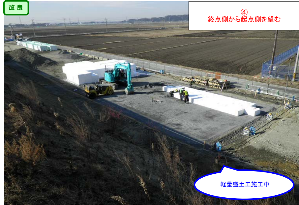
④ 終点側から起点側を望む