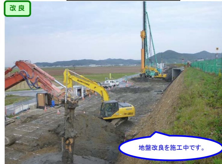
⑤ No.279から終点側を望む