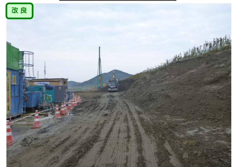
⑥ No.299から終点側を望む