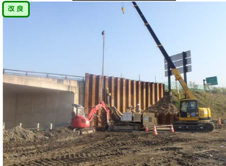
④ 左側から右側を望む