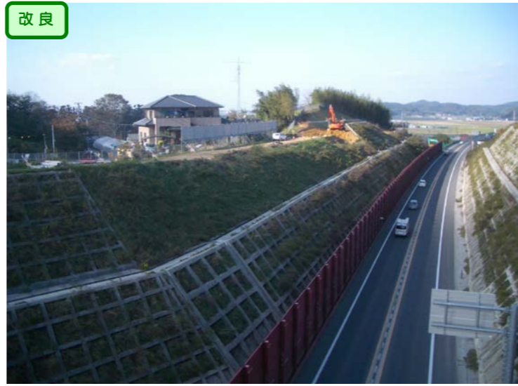
① 右側から左側を望む No.208付近