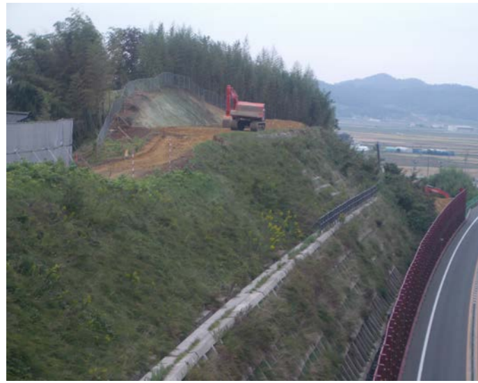
① No.215から終点側を望む