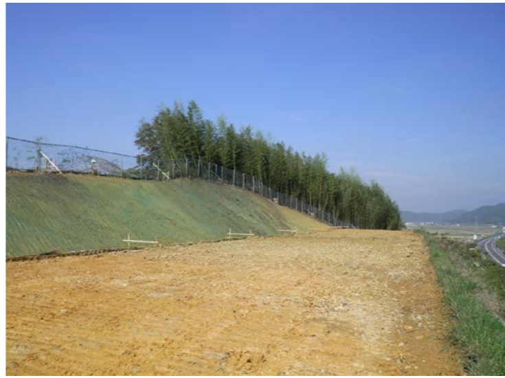
② No.222から終点側を望む