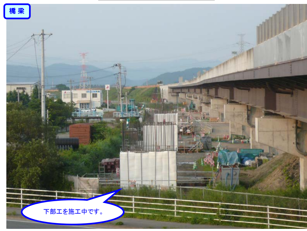
③ 起点側から終点側を望む